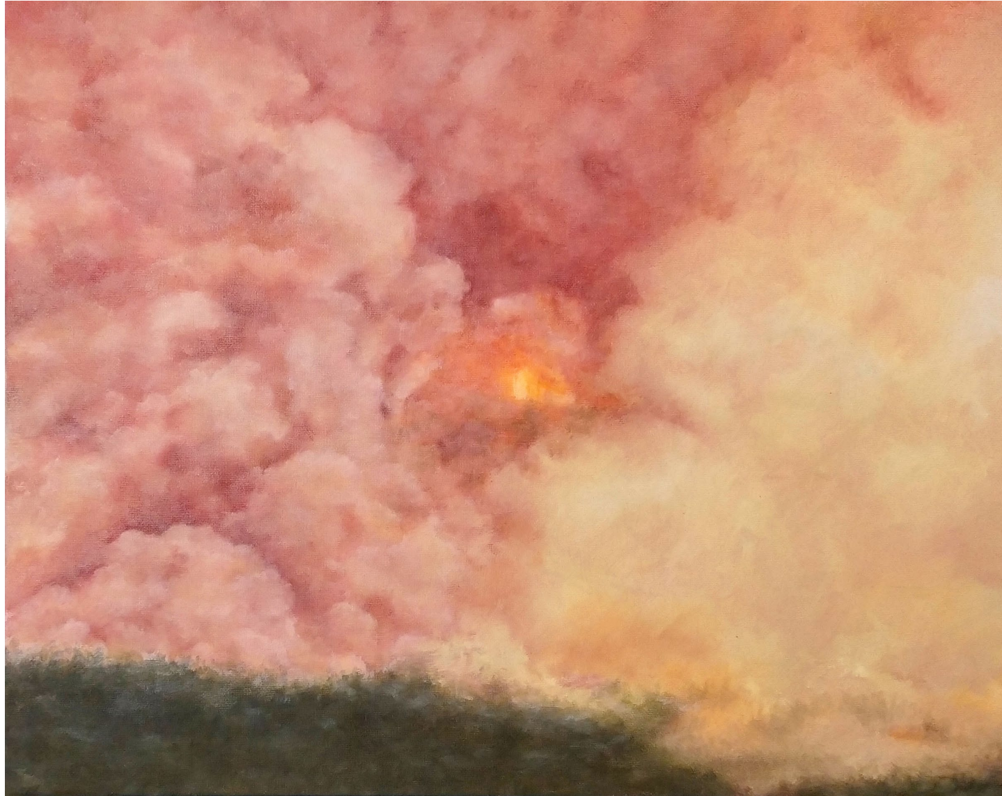
L'œil de feu - 2022, peinture à l'huile sur toile, 33 x 41 cm.