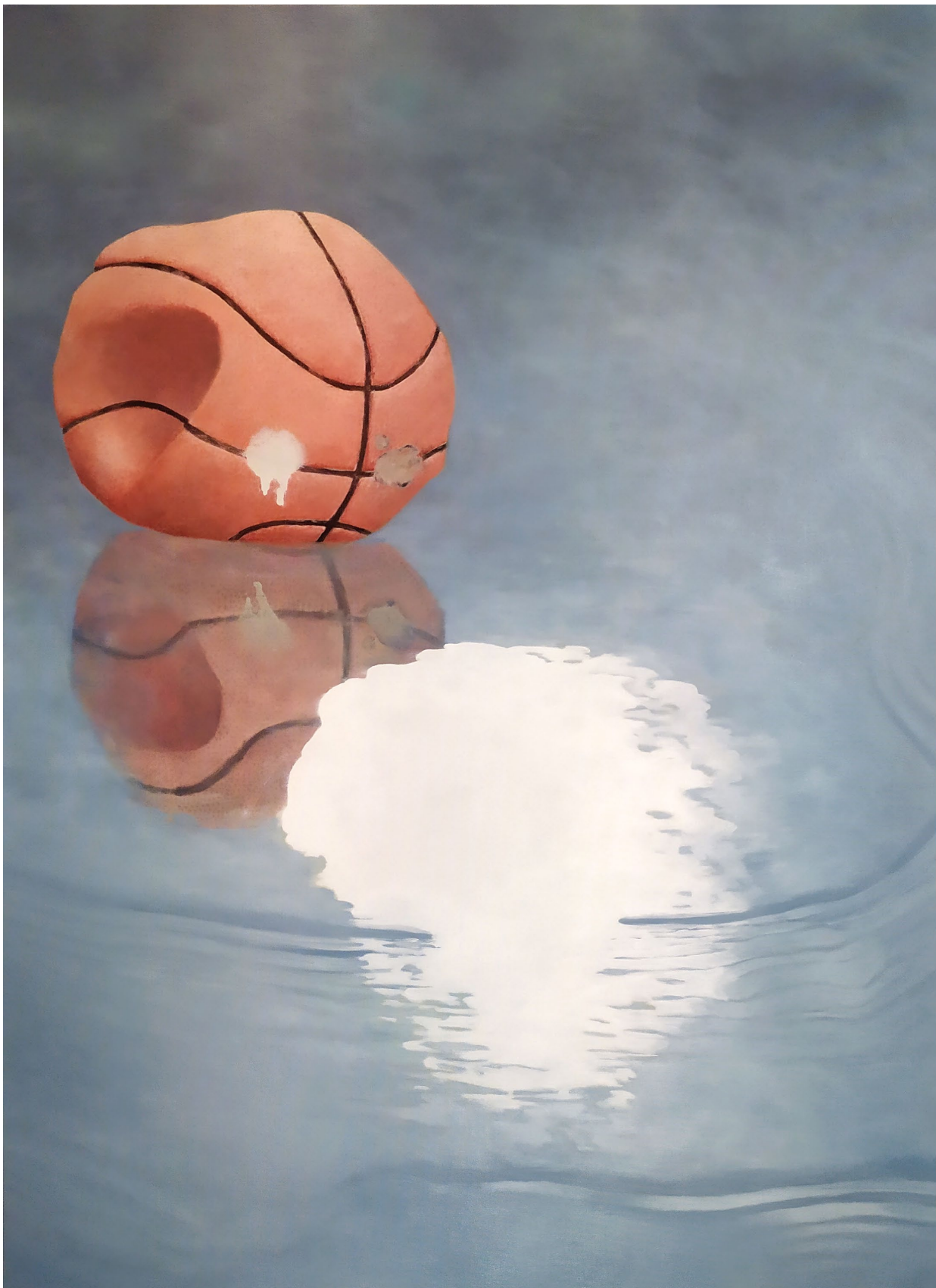
Caput III, Narcisse - 2022, peinture à l'huile sur toile, 100 x 70 cm.