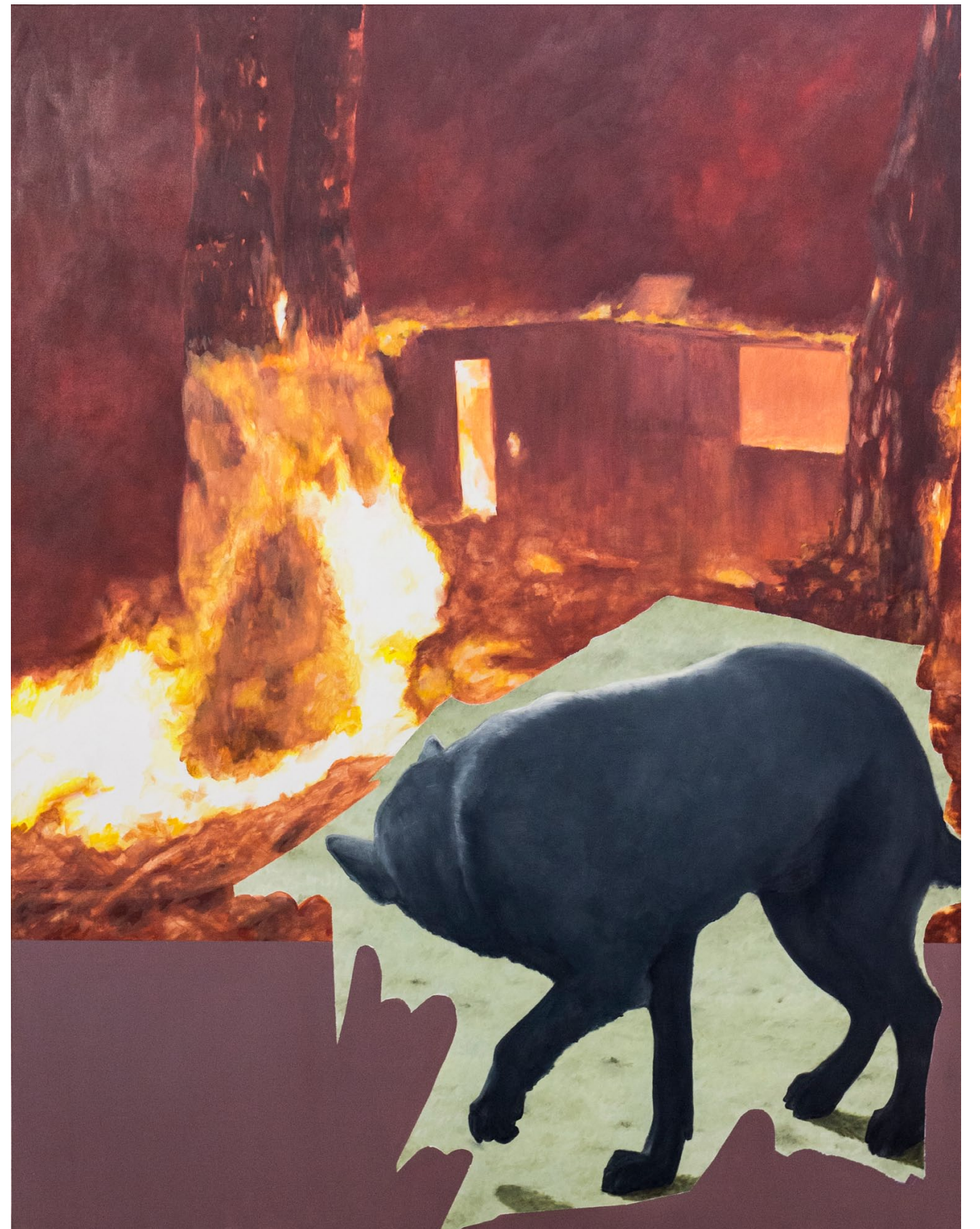
Camp fire (2018) 2 - 2020, peinture à l'huile sur toile, 145 x 115 cm.

«Le feu est ainsi un phénomène privilégié qui peut tout expliquer. Si tout ce qui change lentement s'explique par la vie, tout ce qui change vite s'explique par le feu. Le feu est l'ultra-vivant. Le feu est intime et il est universel.», Gaston Bachelard dans La psychanalyse du feu .