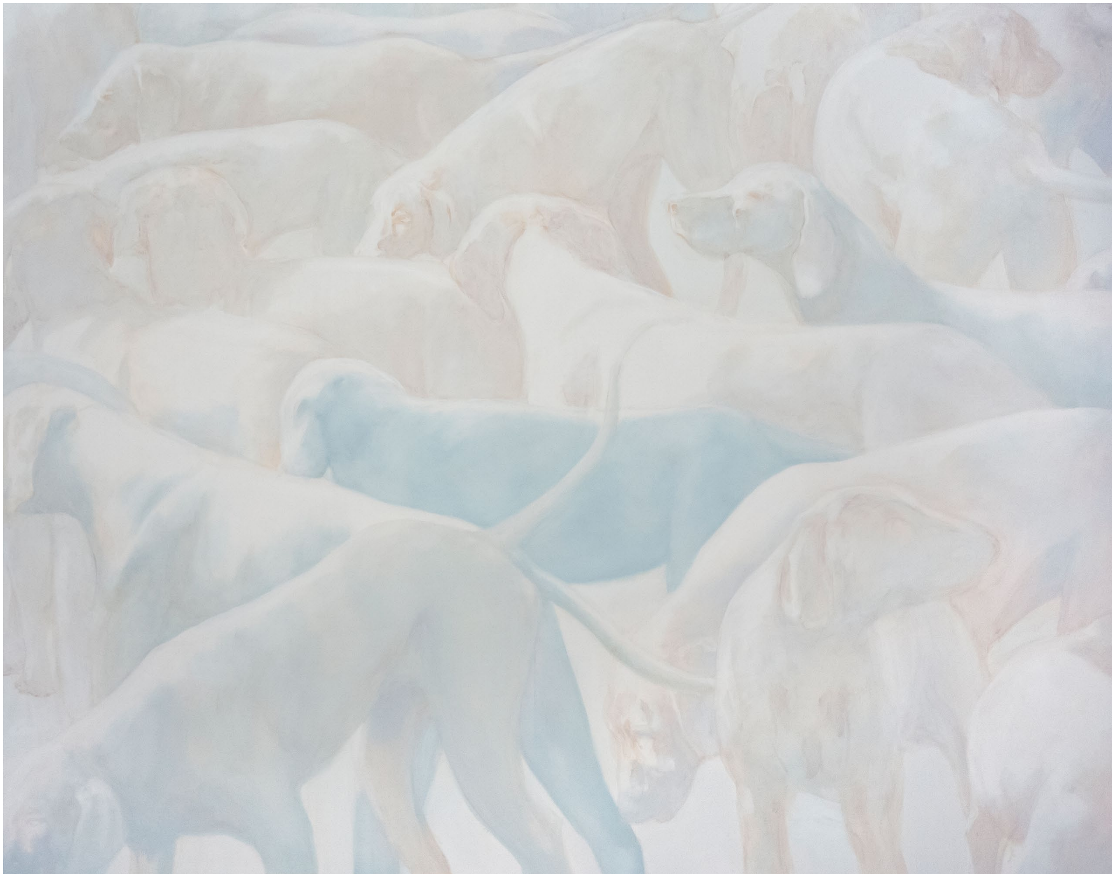
Embâcle - 2021, peinture à l'huile sur toile, 115 x 145 cm.