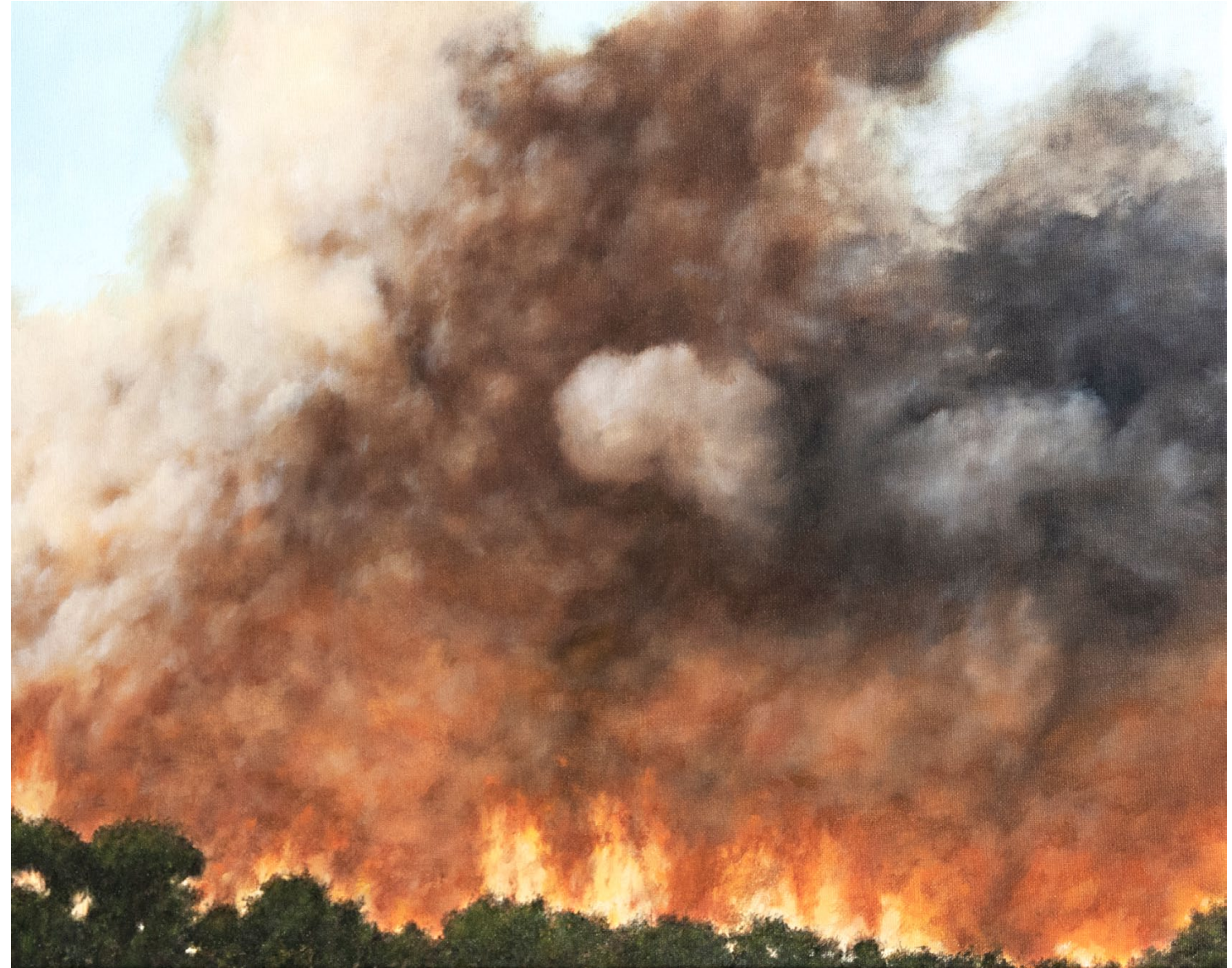
Léchappée - 2024, peinture à l'huile sur toile, 33 x 41cm.