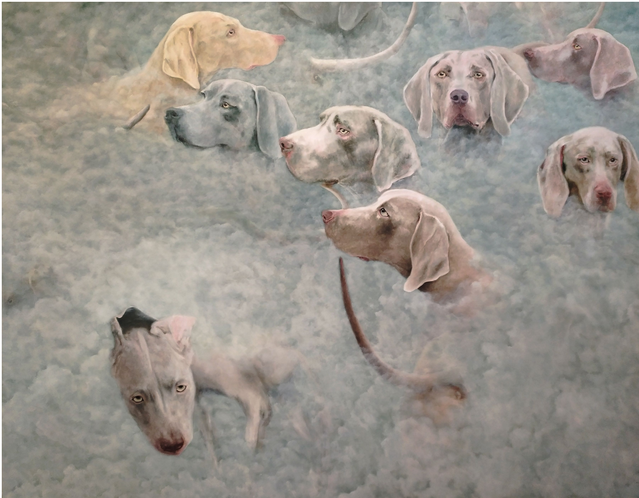
Cerbère - 2022, peinture à l'huile sur toile, 115 x 145 cm.