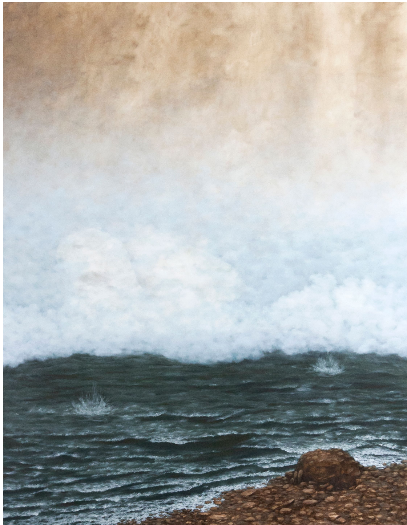
Caput IX, La chute - 2024, peinture à l'huile sur toile, 180 x 140 cm.