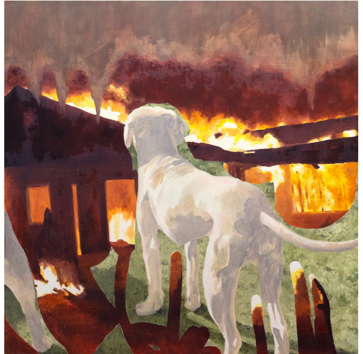
Foyer - 2021, peinture à l'huile sur toile, 115 x 145 cm.