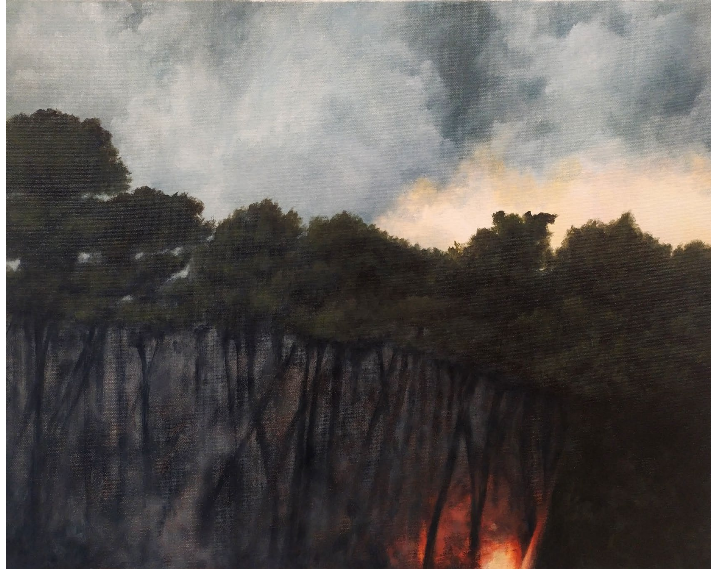
Le départ - 2022, peinture à l'huile sur toile, 33 x 41 cm.