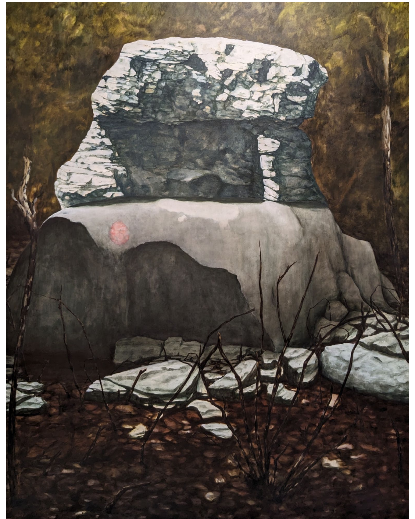
Caput VI, Les triplés de Lussas - 2023, peinture à l'huile sur toile, 180 x 140 cm.