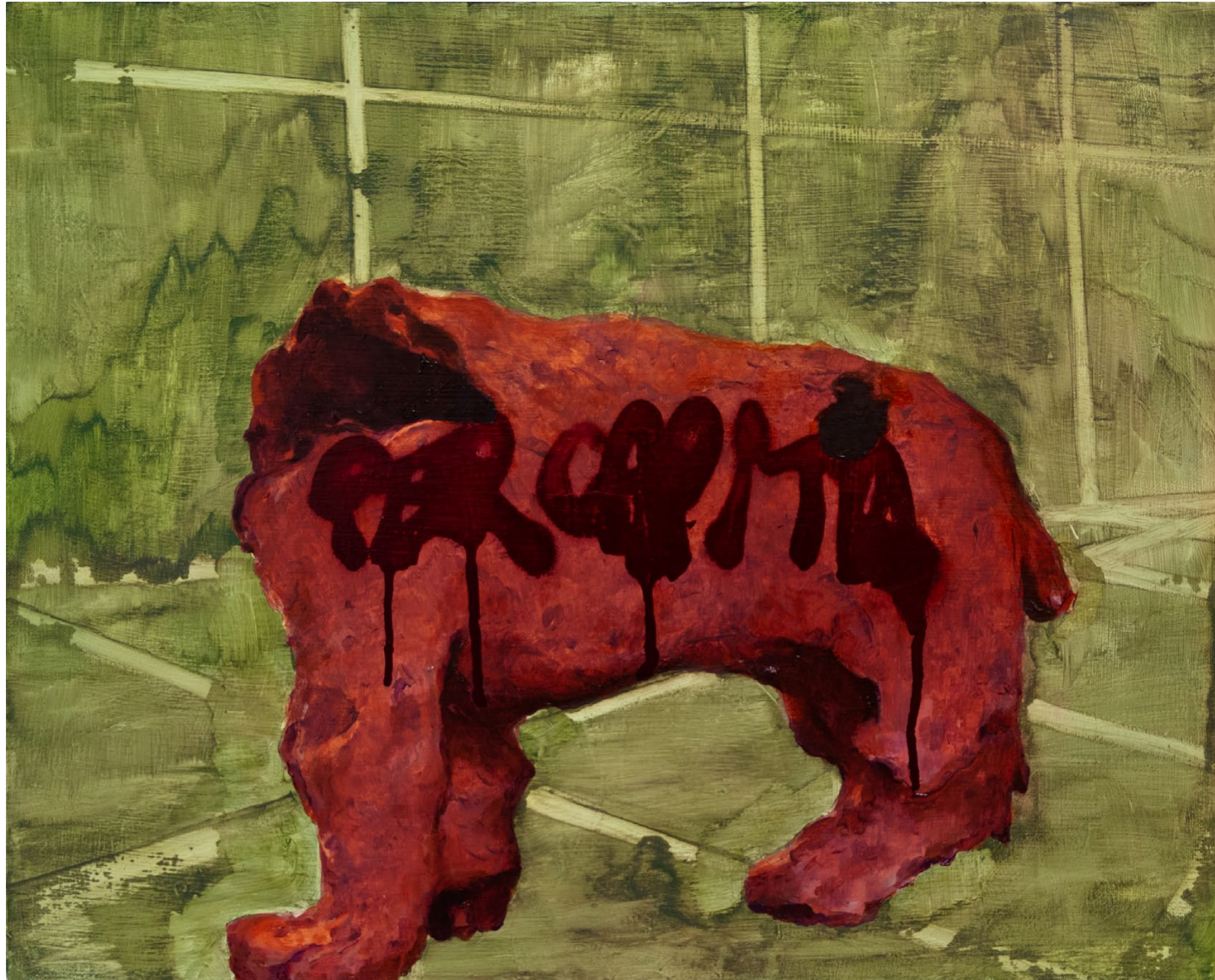
Caput - 2020, peinture à l'huile et bombe aérosol, 40 x 50 cm.