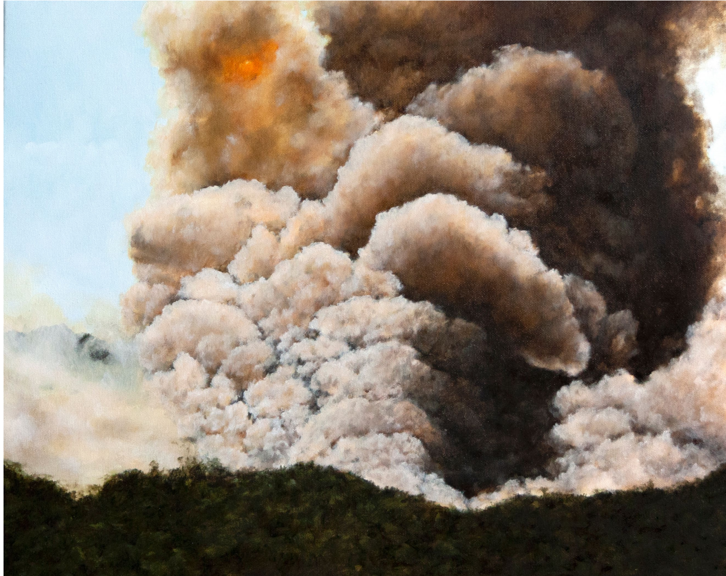
Déferlement - 2023, peinture à l'huile sur toile, 33 x 41 cm.