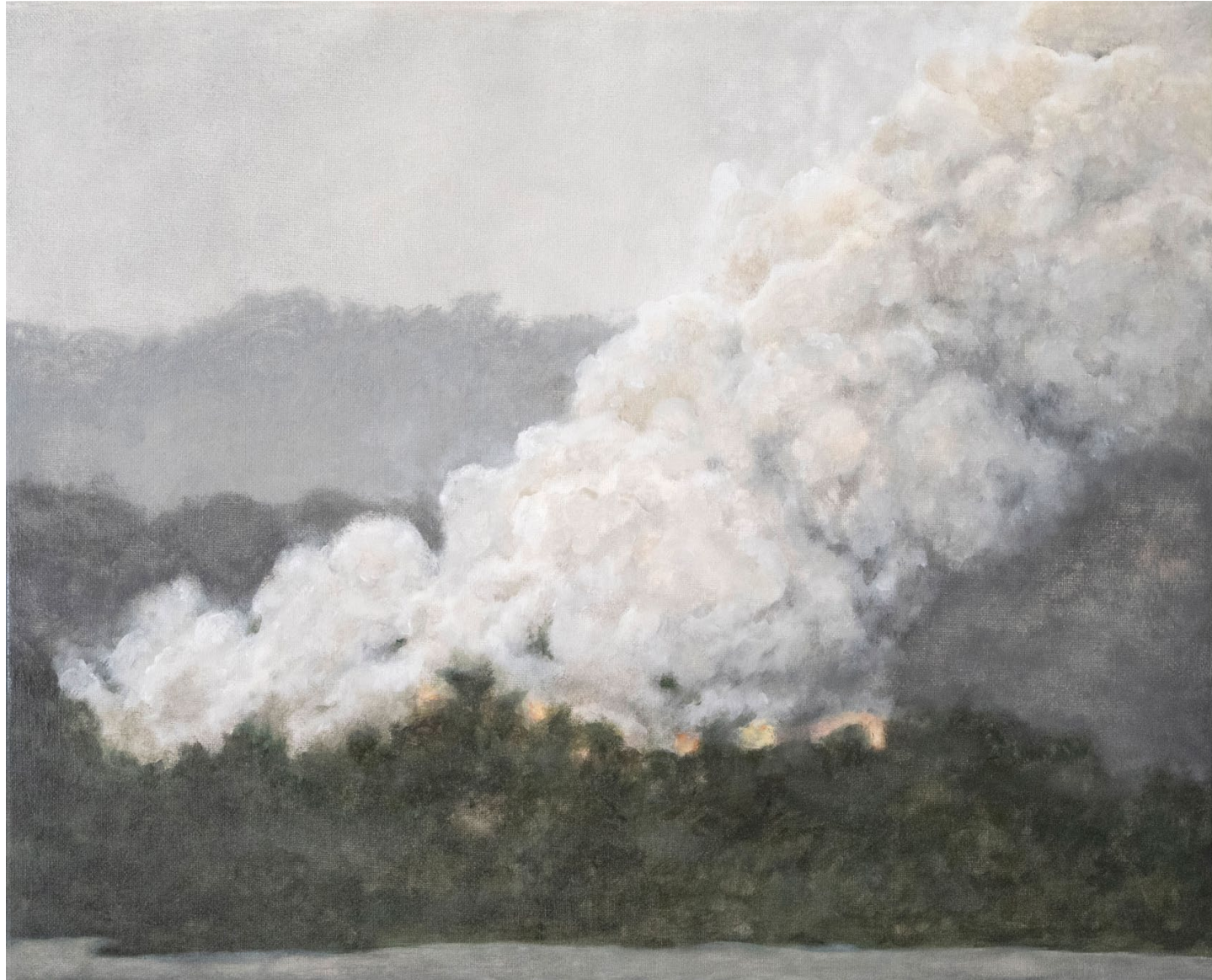
Pyromane 2 - 2021, peinture à l'huile sur toile, 33 x 41 cm.