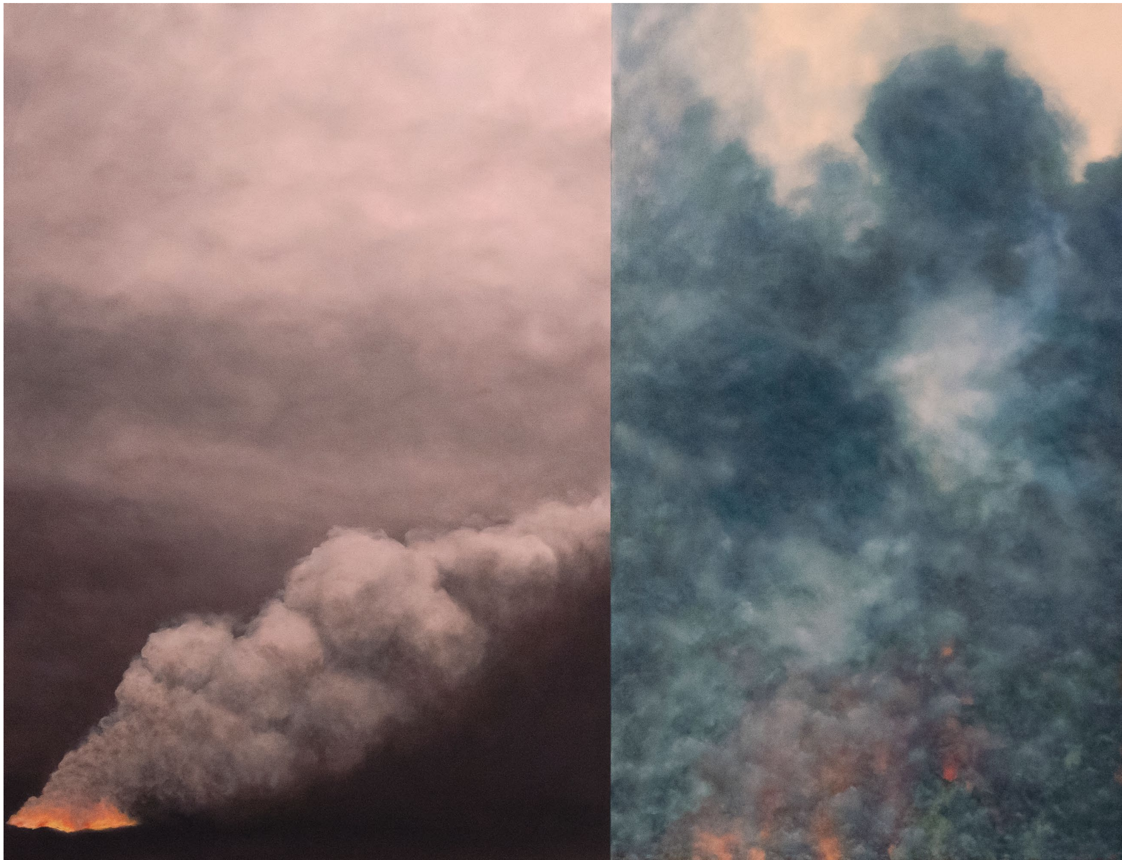
Brasier - 2022, peinture à l'huile sur toile, 90 x 115 cm.