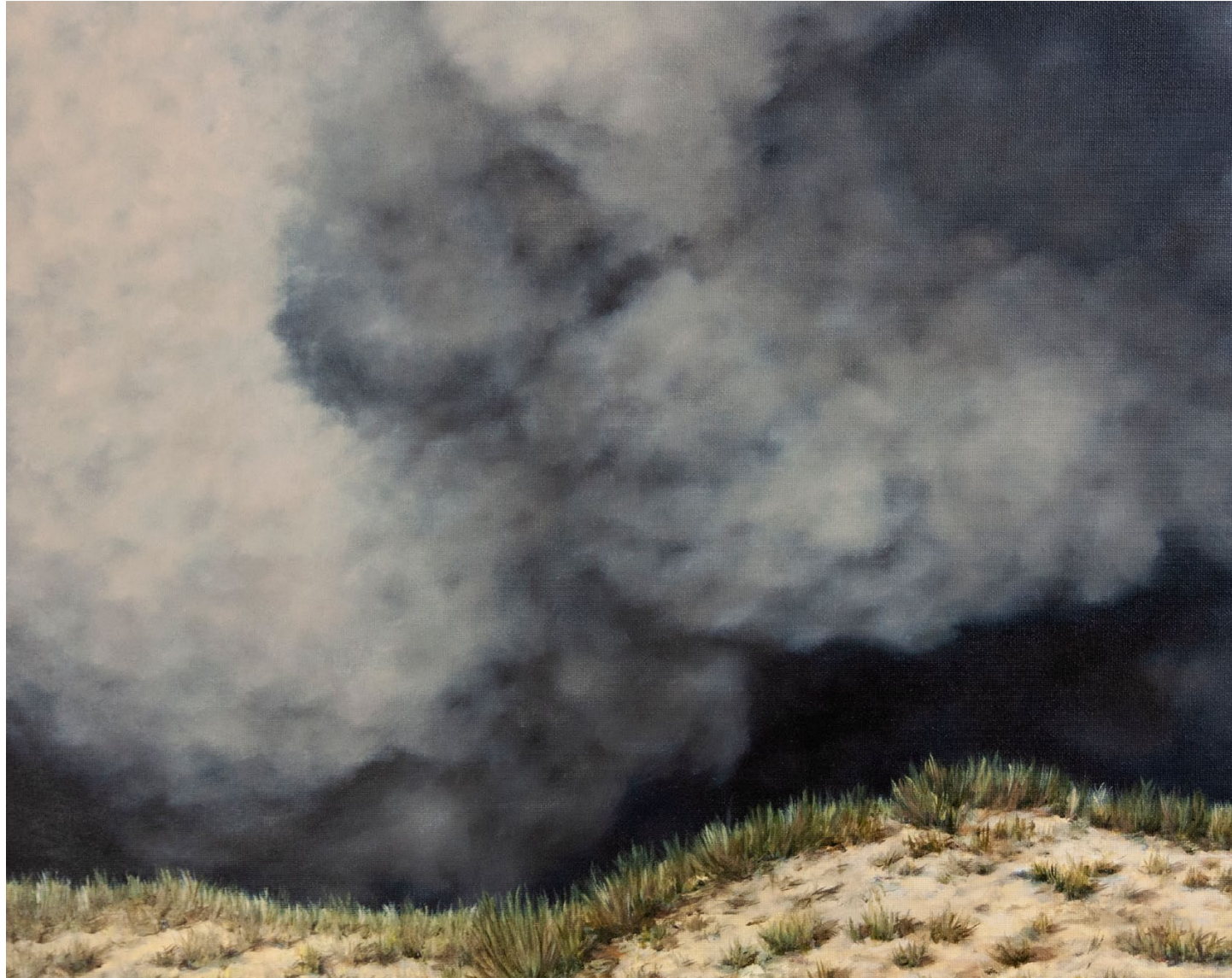
L'éclipsé - 2024, peinture à l'huile sur toile, 33 x 41cm.