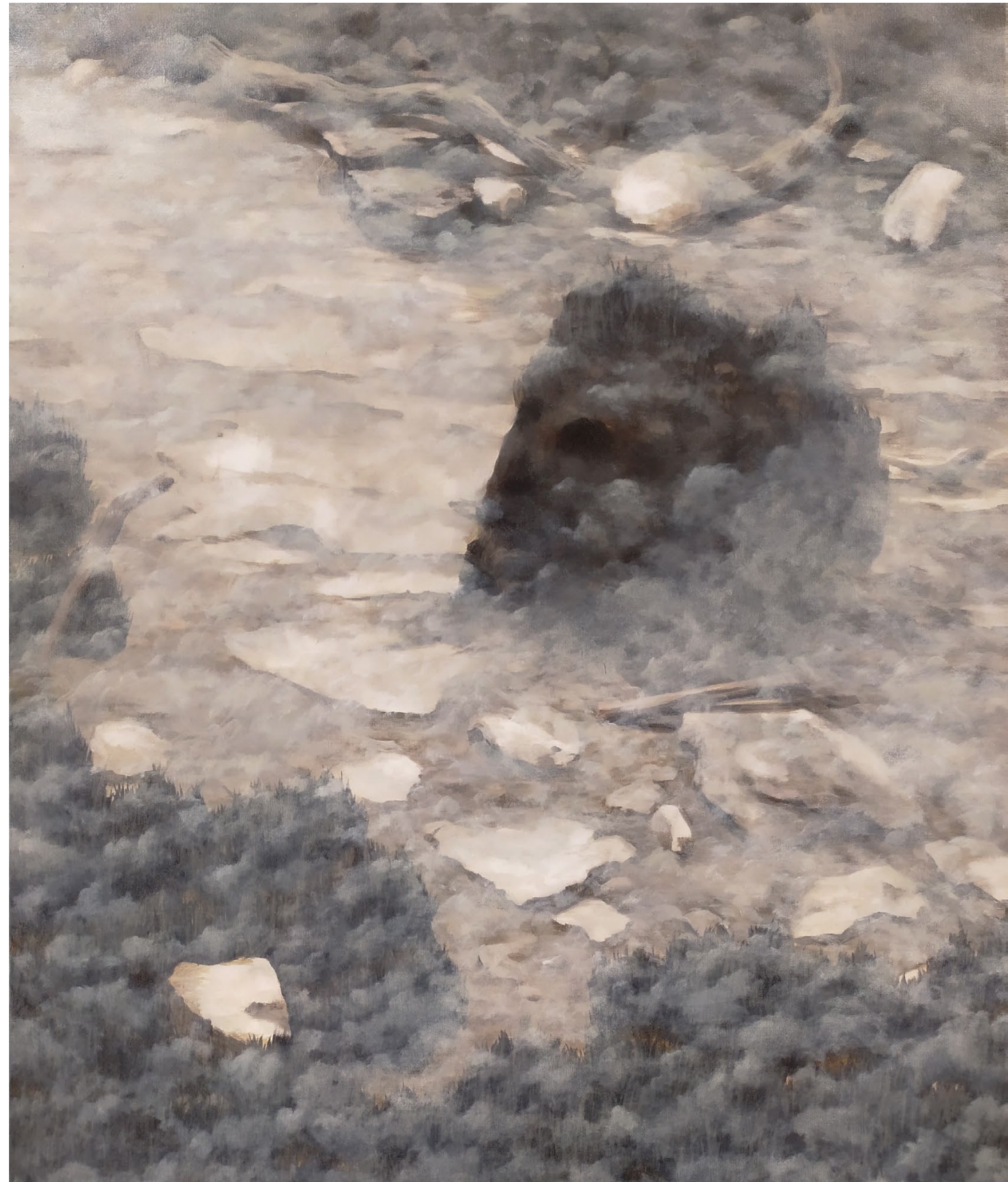
Caput IV, Tête brûlée - 2023, peinture à l'huile sur toile, 73 x 60 cm.