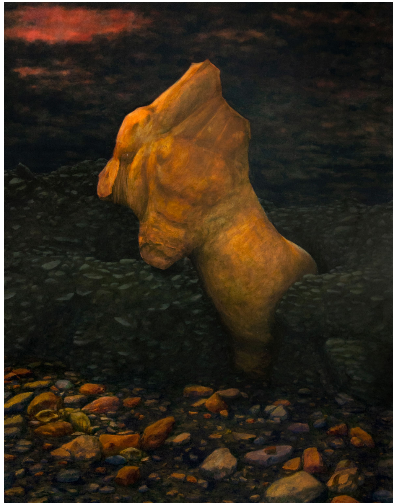
Caput VII, Carcasse - 2023, peinture à l'huile sur toile, 180 x 140 cm.