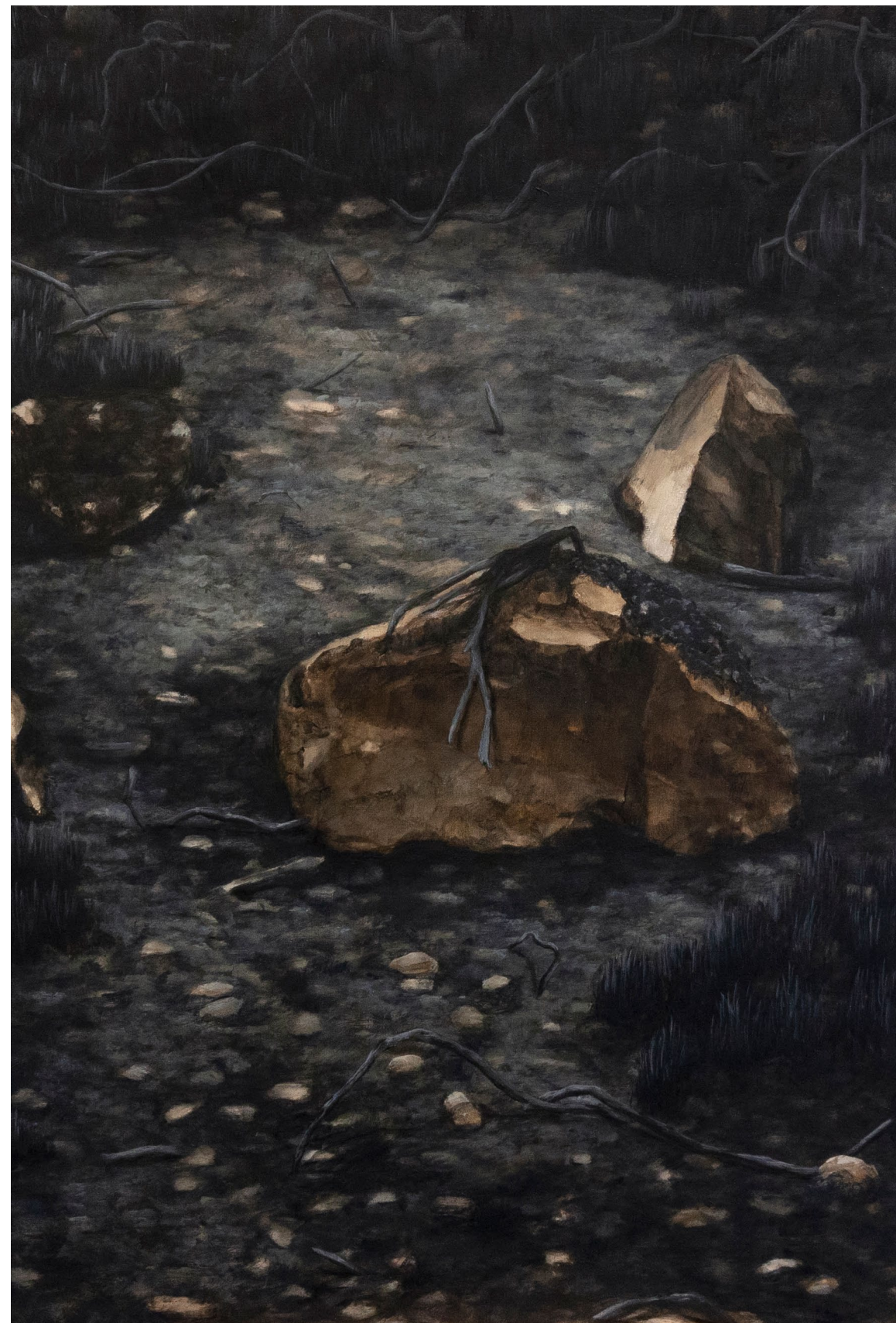
Caput VIII, Cabot - 2023, peinture à l'huile sur toile, 73 x 50 cm.