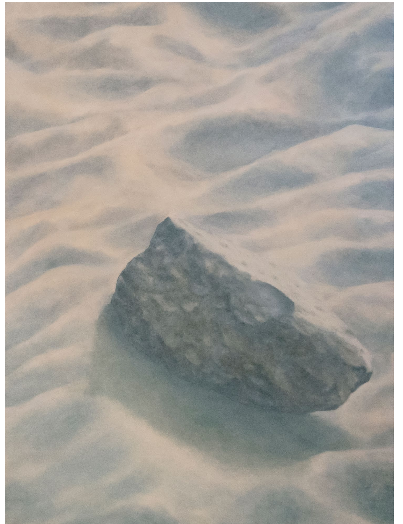
Caput II, Tête de chien - 2022, peinture à l'huile sur toile, 80 x 60 cm.