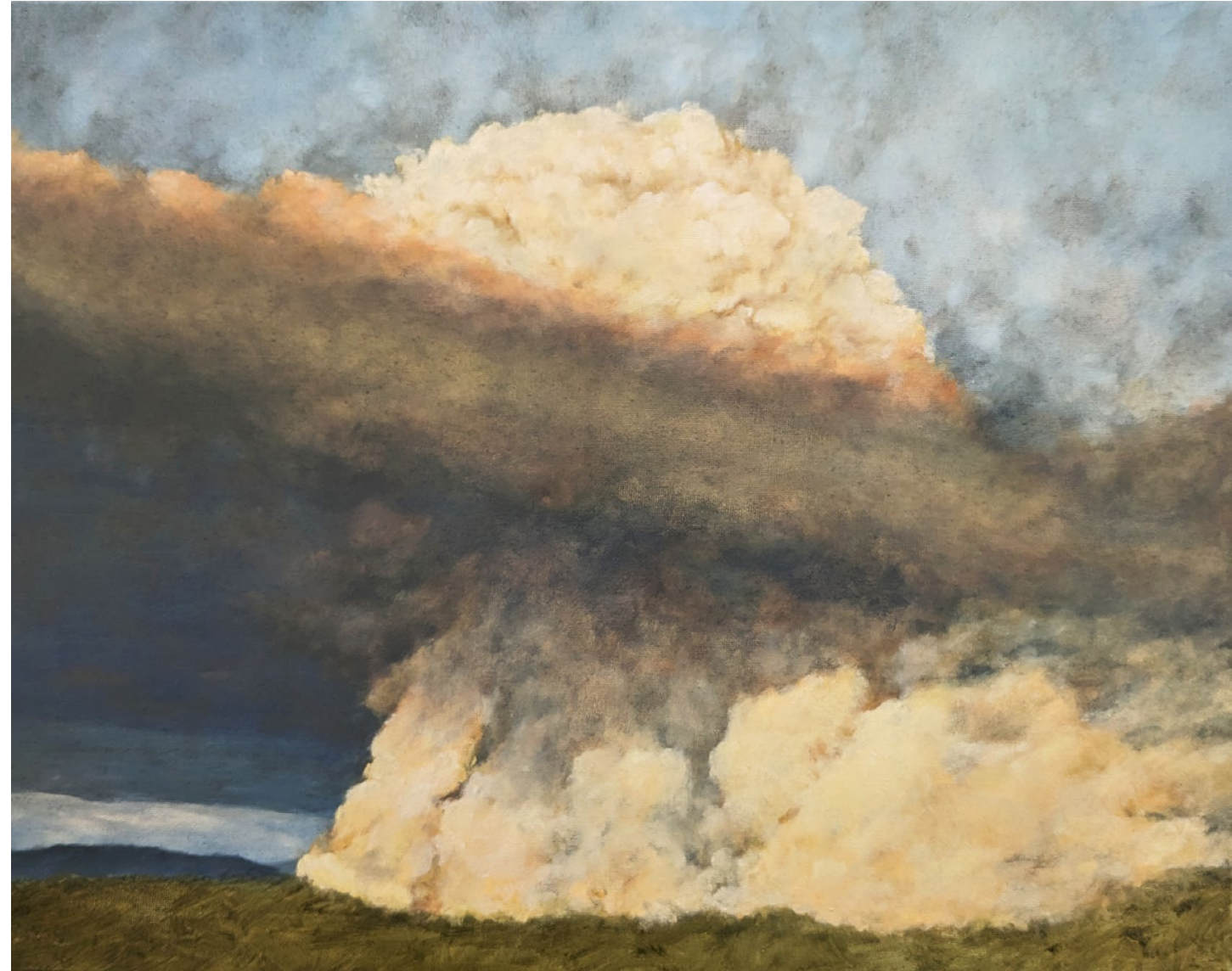
La bouffée - 2023, peinture à l'huile sur toile, 33 x 41 cm.