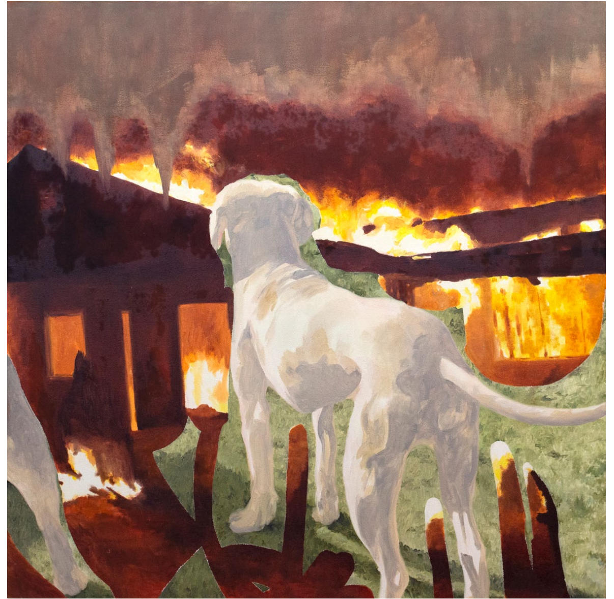
Camp fire (2018) 1 - 2020, peinture à l'huile sur toile, 120 x 120 cm.