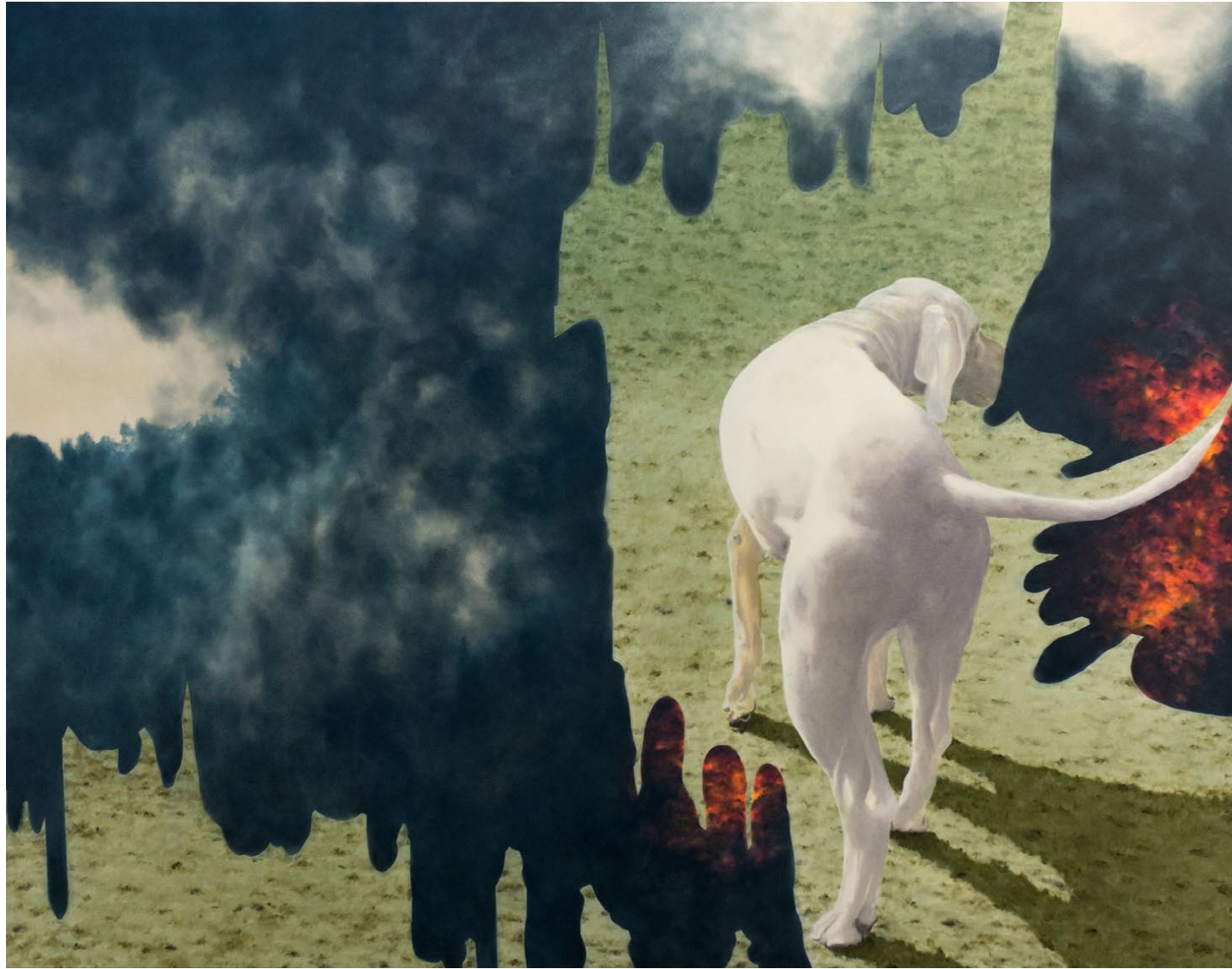
Foyer - 2021, peinture à l'huile sur toile, 115 x 145 cm.