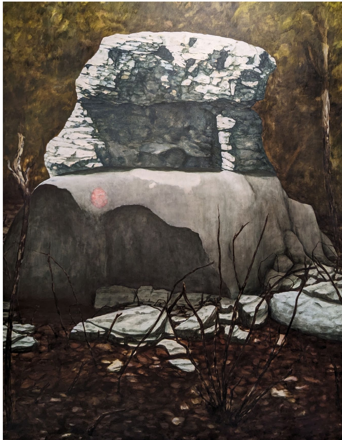
Caput VI, Les triplés de Lussas - 2023, peinture à l'huile sur toile, 180 x 140 cm.