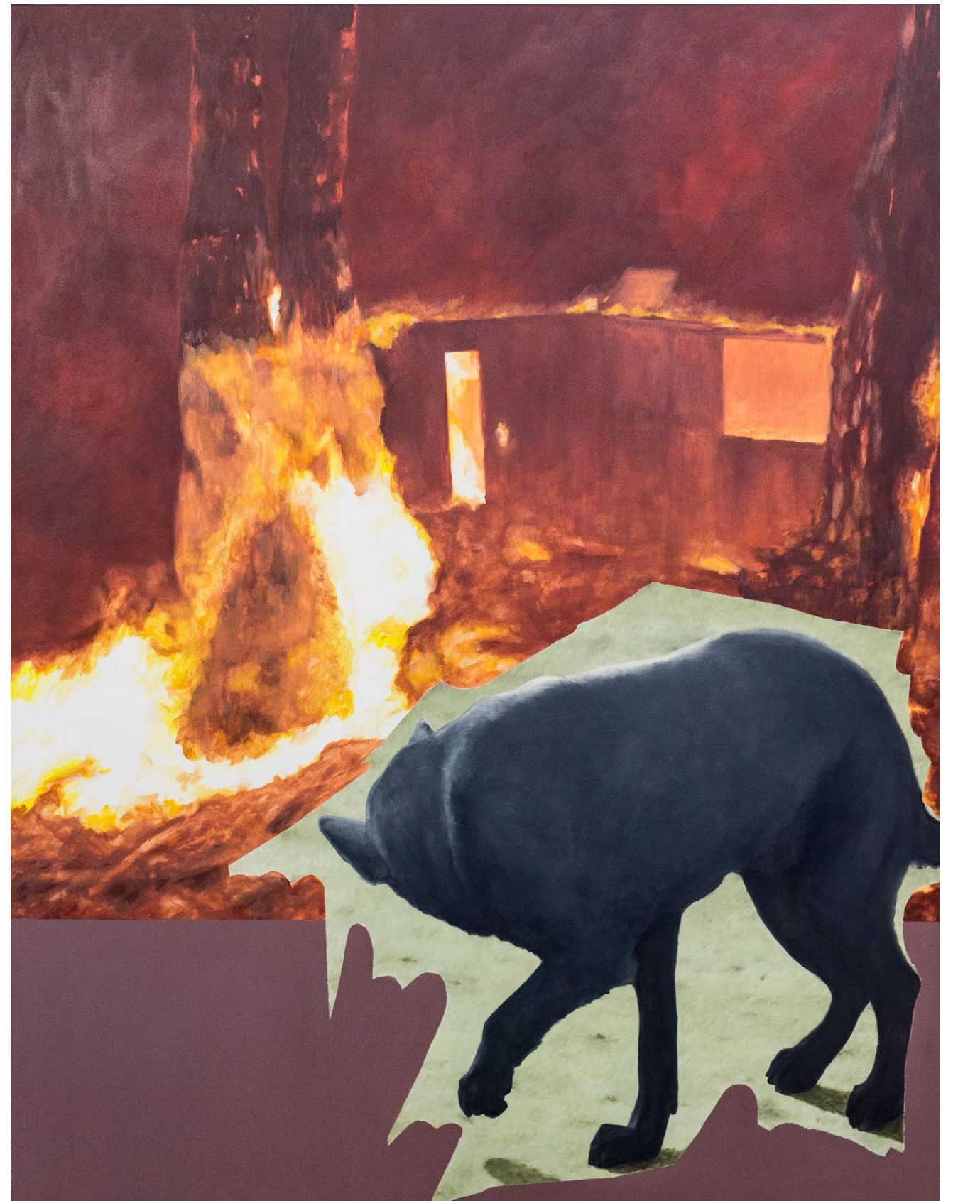
Camp fire (2018) 2 - 2020, peinture à l'huile sur toile, 145 x 115 cm.

«Le feu est ainsi un phénomène privilégié qui peut tout expliquer. Si tout ce qui change lentement s'explique par la vie, tout ce qui change vite s'explique par le feu. Le feu est l'ultra-vivant. Le feu est intime et il est universel.» Gaston Bachelard dans La psychanalyse du feu .