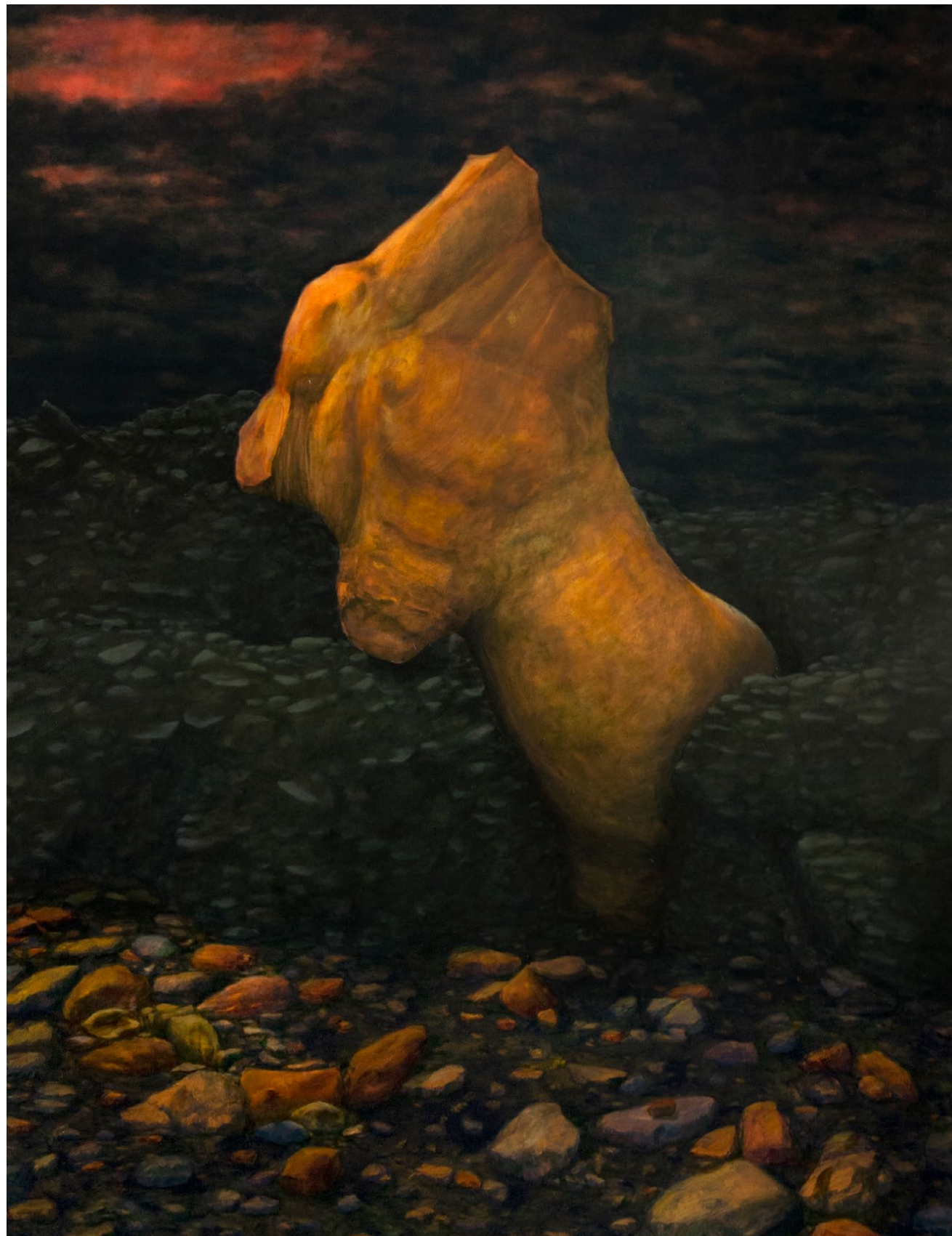
Caput VII, Carcasse - 2023, peinture à l'huile sur toile, 180 x 140 cm.