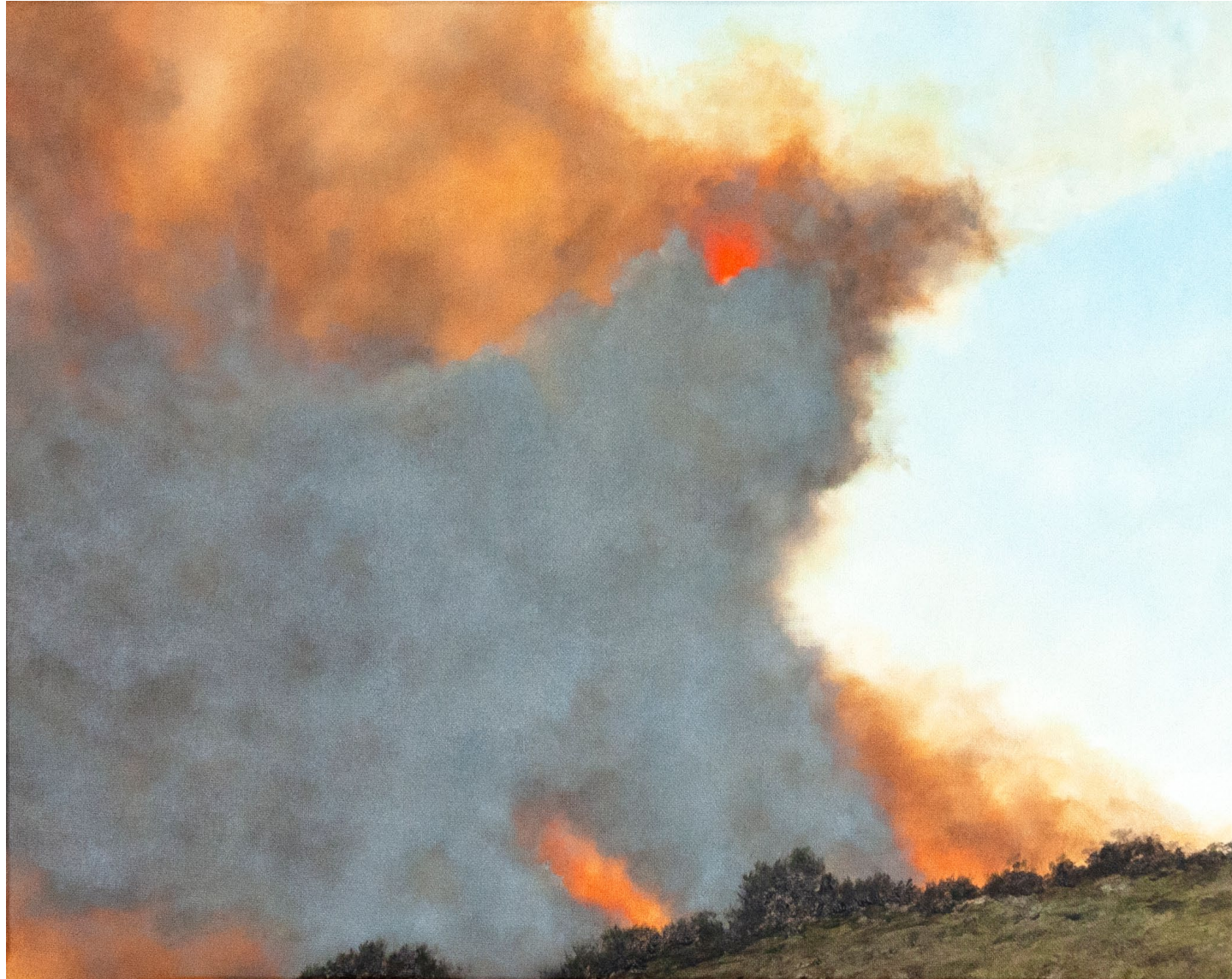
La lueur - 2024, peinture à l'huile sur toile, 33 x 41cm.