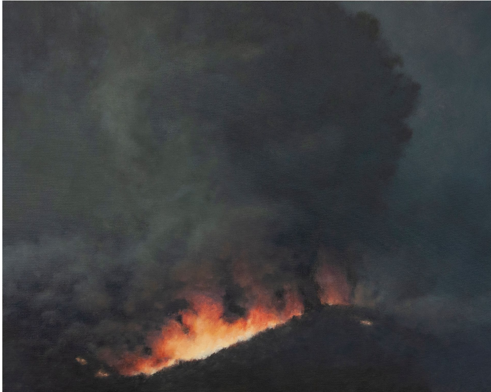
Demi-jour - 2024, peinture à l'huile sur toile, 33 x 41cm.