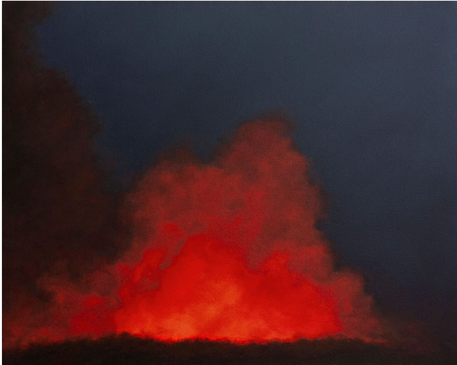
L'avant-nuit - 2024, peinture à l'huile sur toile, 33 x 41cm.