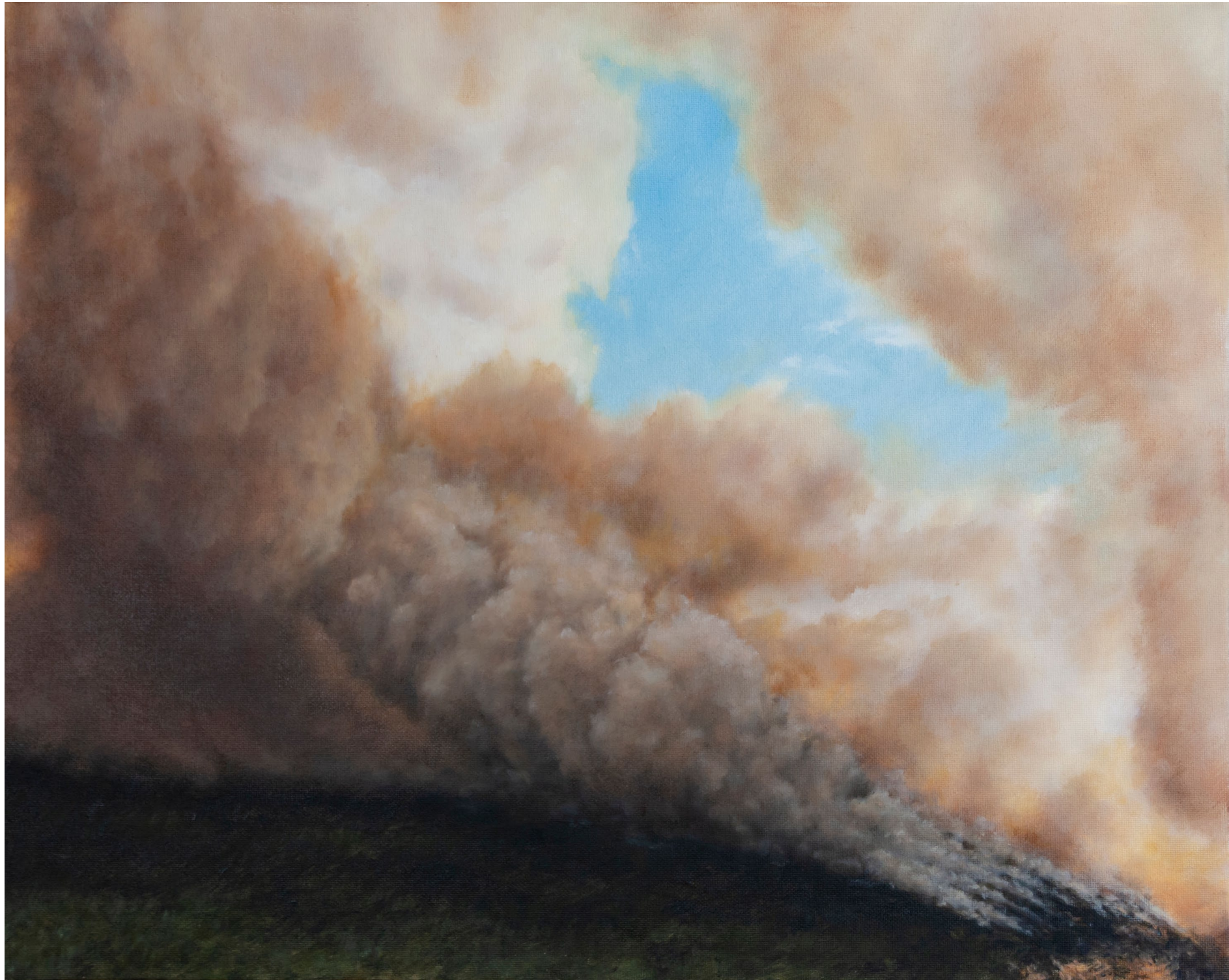
La percée - 2024, peinture à l'huile sur toile, 33 x 41cm.