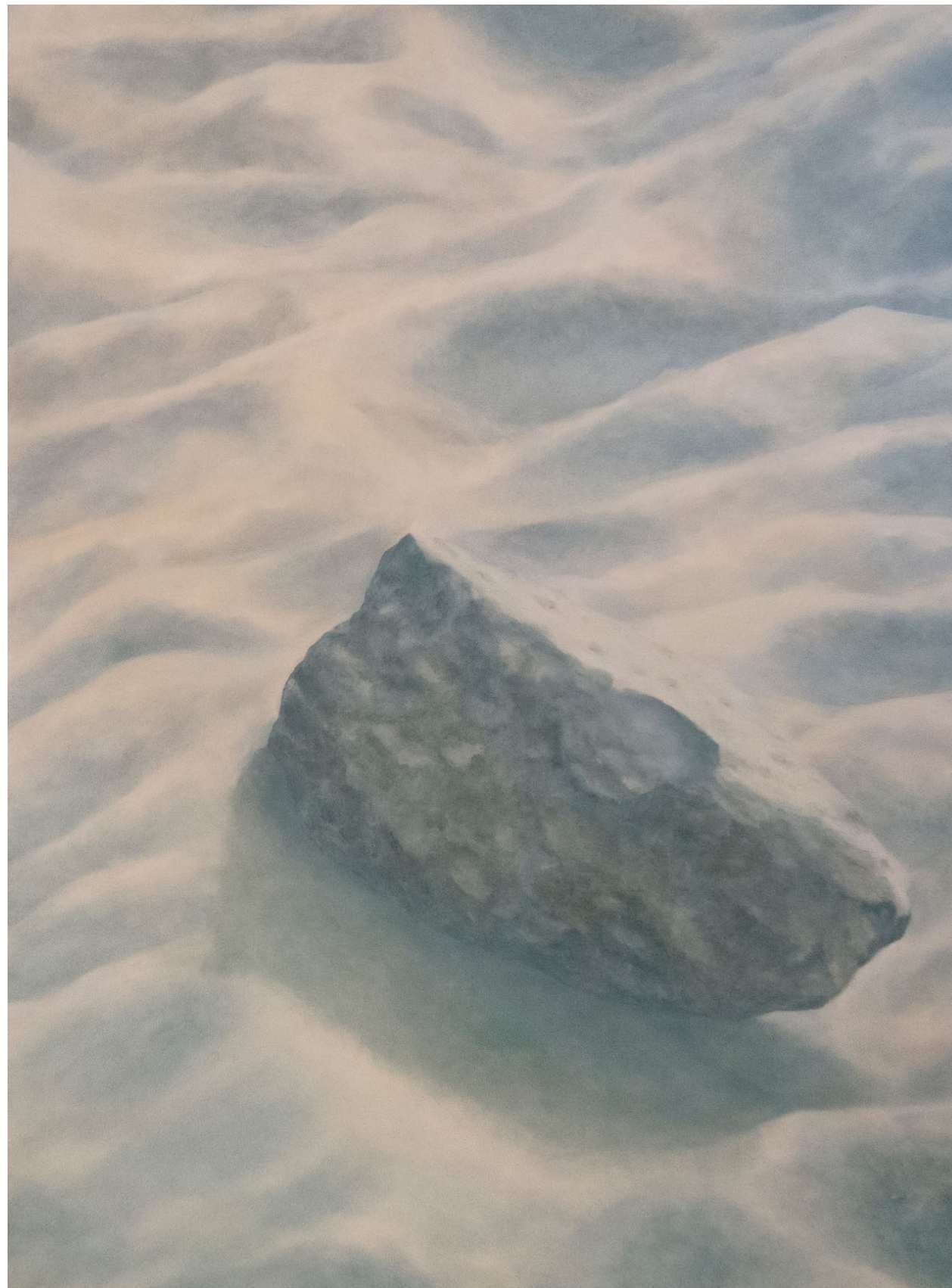
Caput II, Tête de chien - 2022, peinture à l'huile sur toile, 80 x 60 cm.