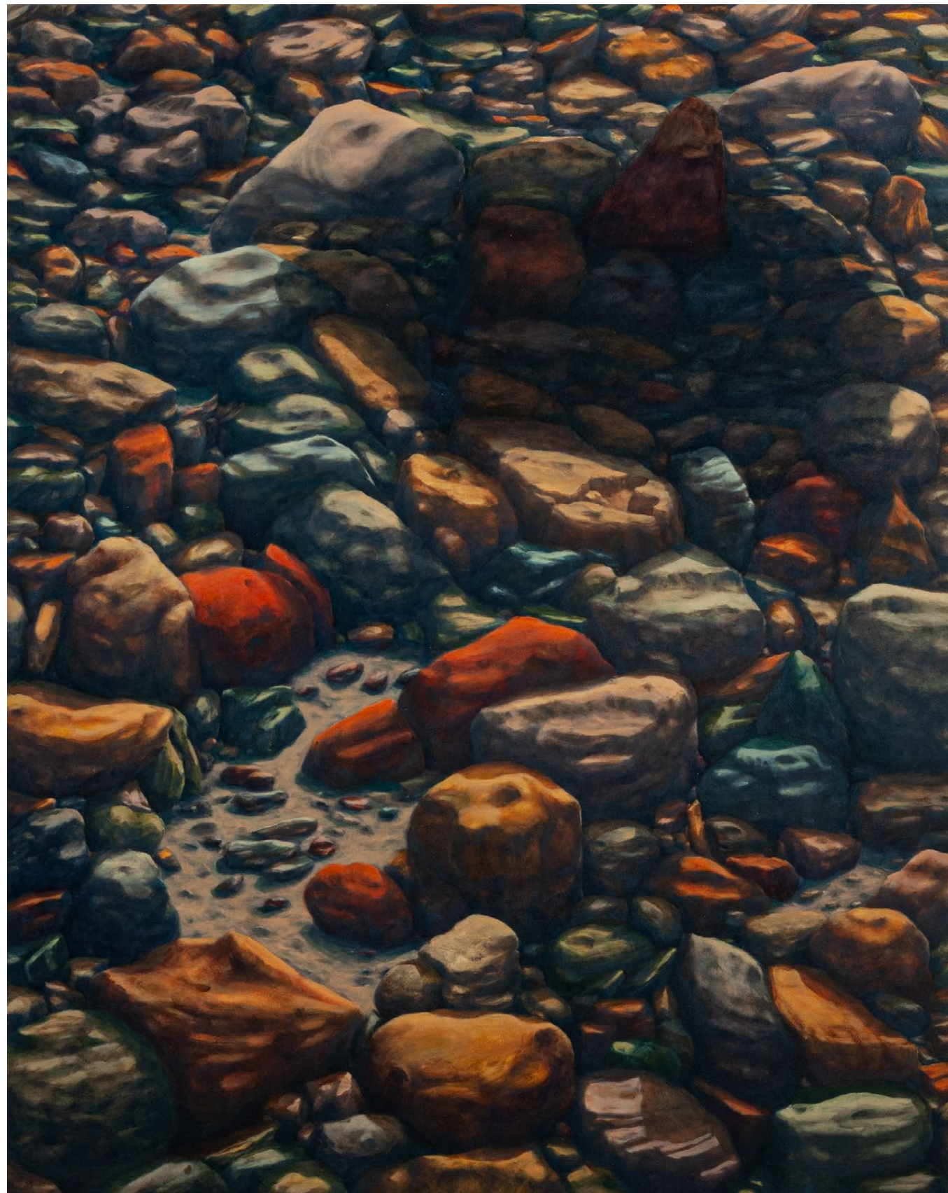
Éclats - 2025, peinture à l'huile sur toile, 100 x 81 cm.