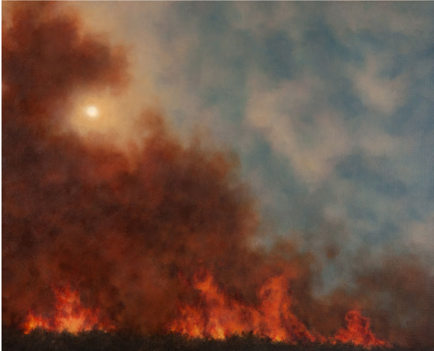
Feu double - 2025, peinture à l'huile sur toile, 33 x 41 cm.