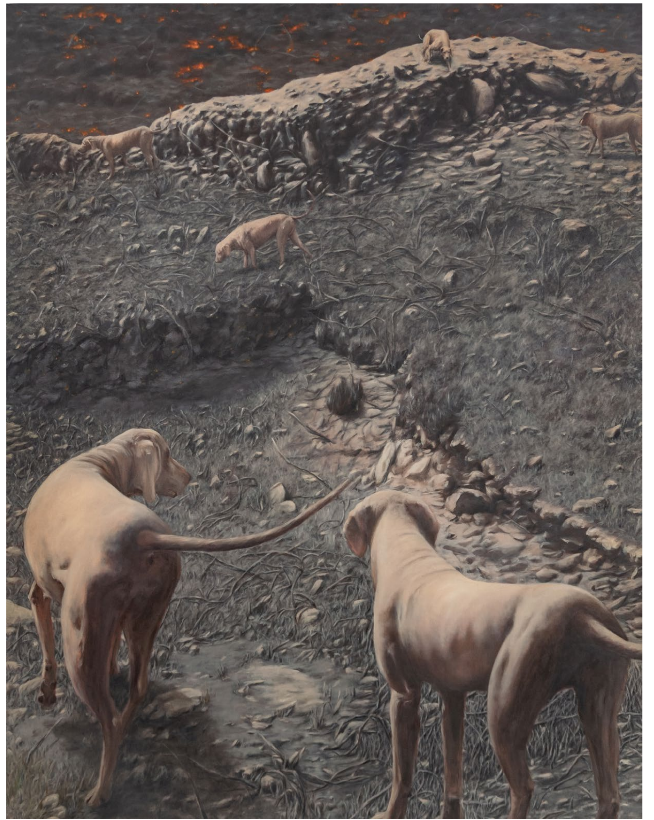
Chiens et Monts d'Arrée - 2025, peinture à l'huile sur toile, 145 x 115 cm.