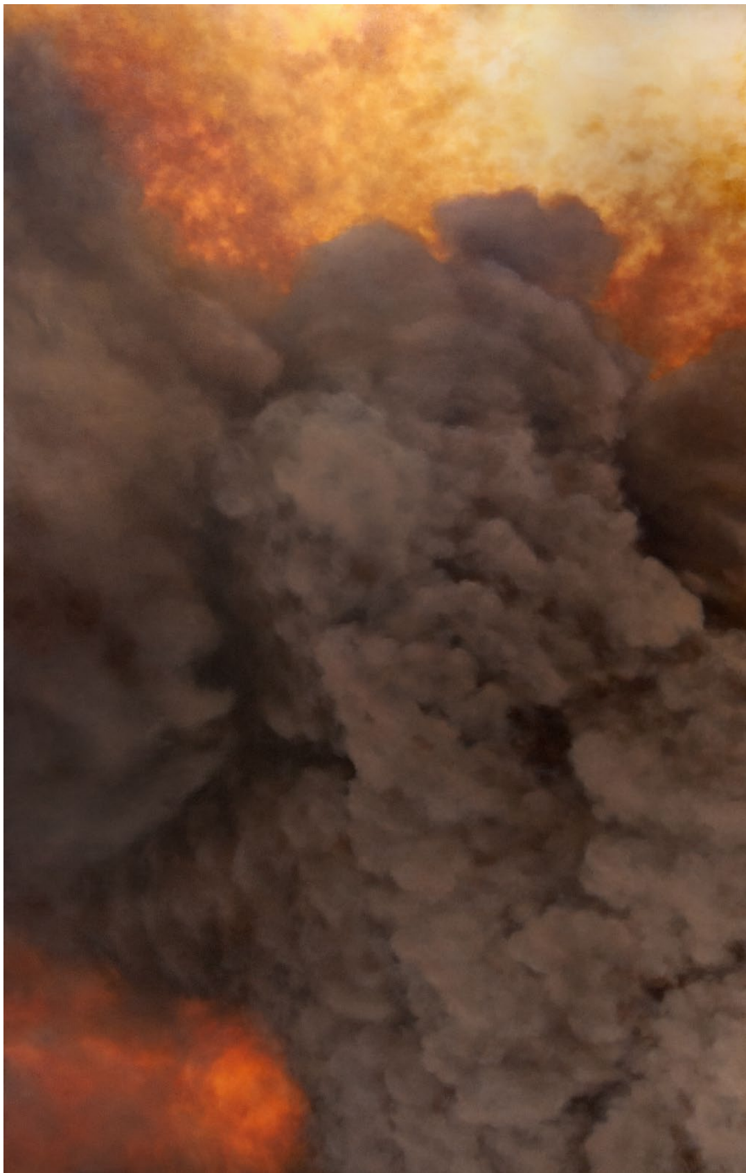
L'Heure dorée I - 2025, peinture à l'huile sur toile, 322 x 205 cm.