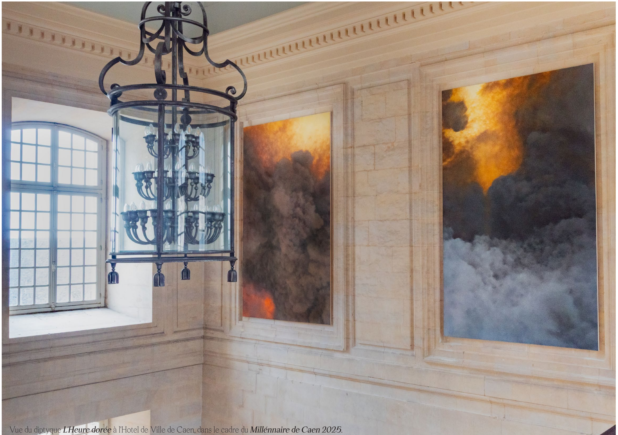
Vue du diptyque L'Heure dorée à l'Hotel de Ville de Caen, dans le cadre du Millénaire de Caen 2025 .