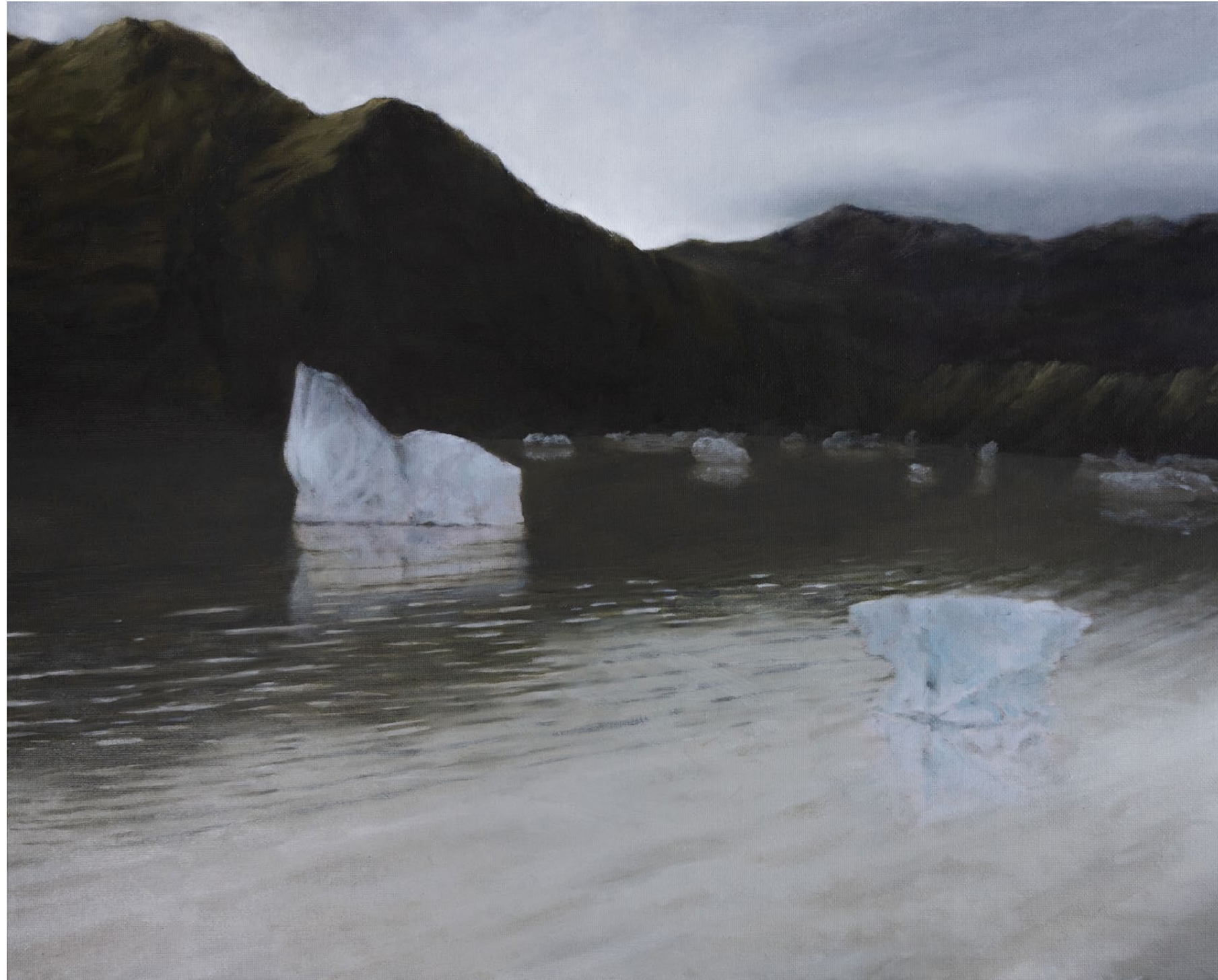
Les Naufragés - 2024, peinture à l'huile sur toile, 33 x 41 cm.