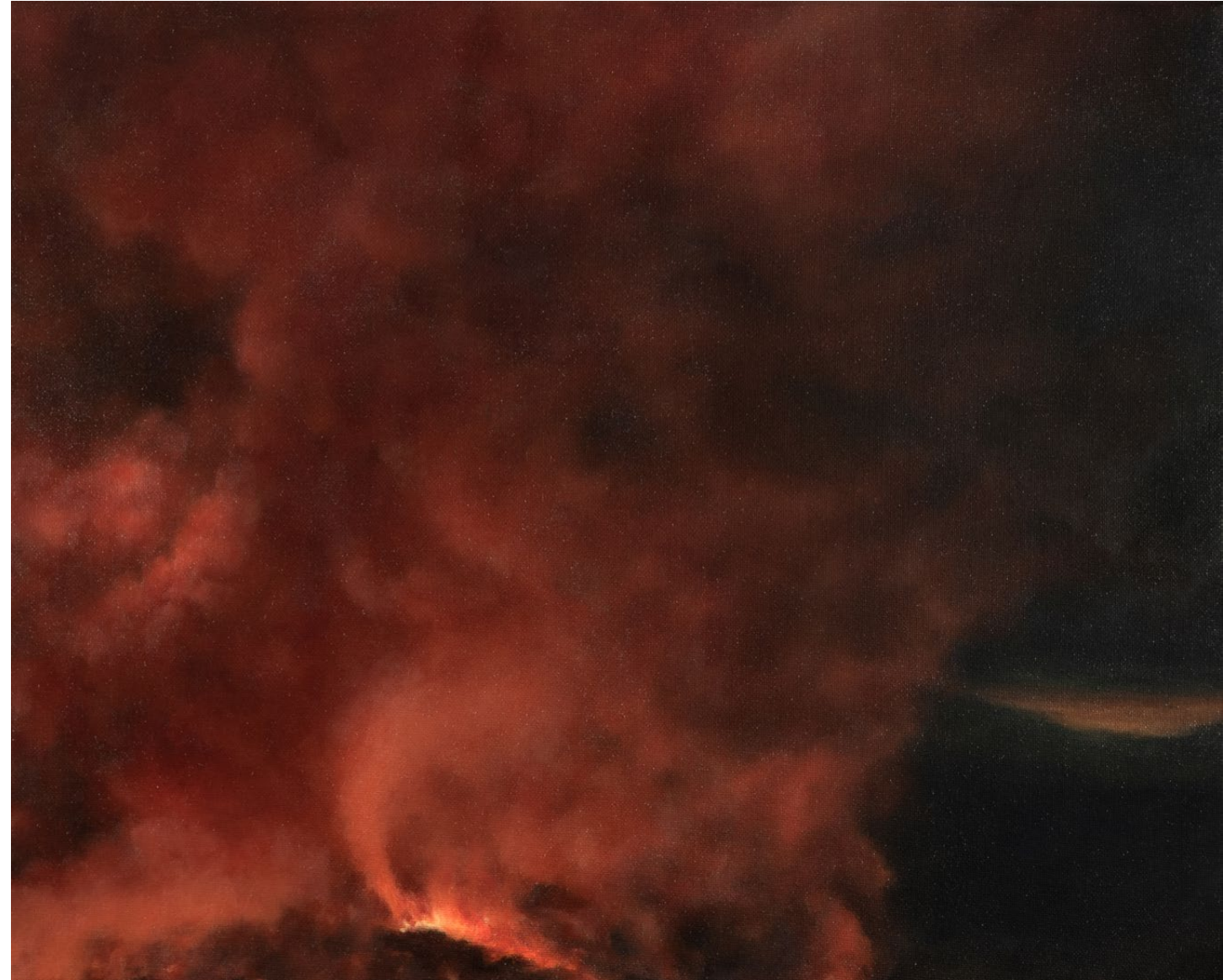
Le Déclin - 2025, peinture à l'huile sur toile, 33 x 41 cm.