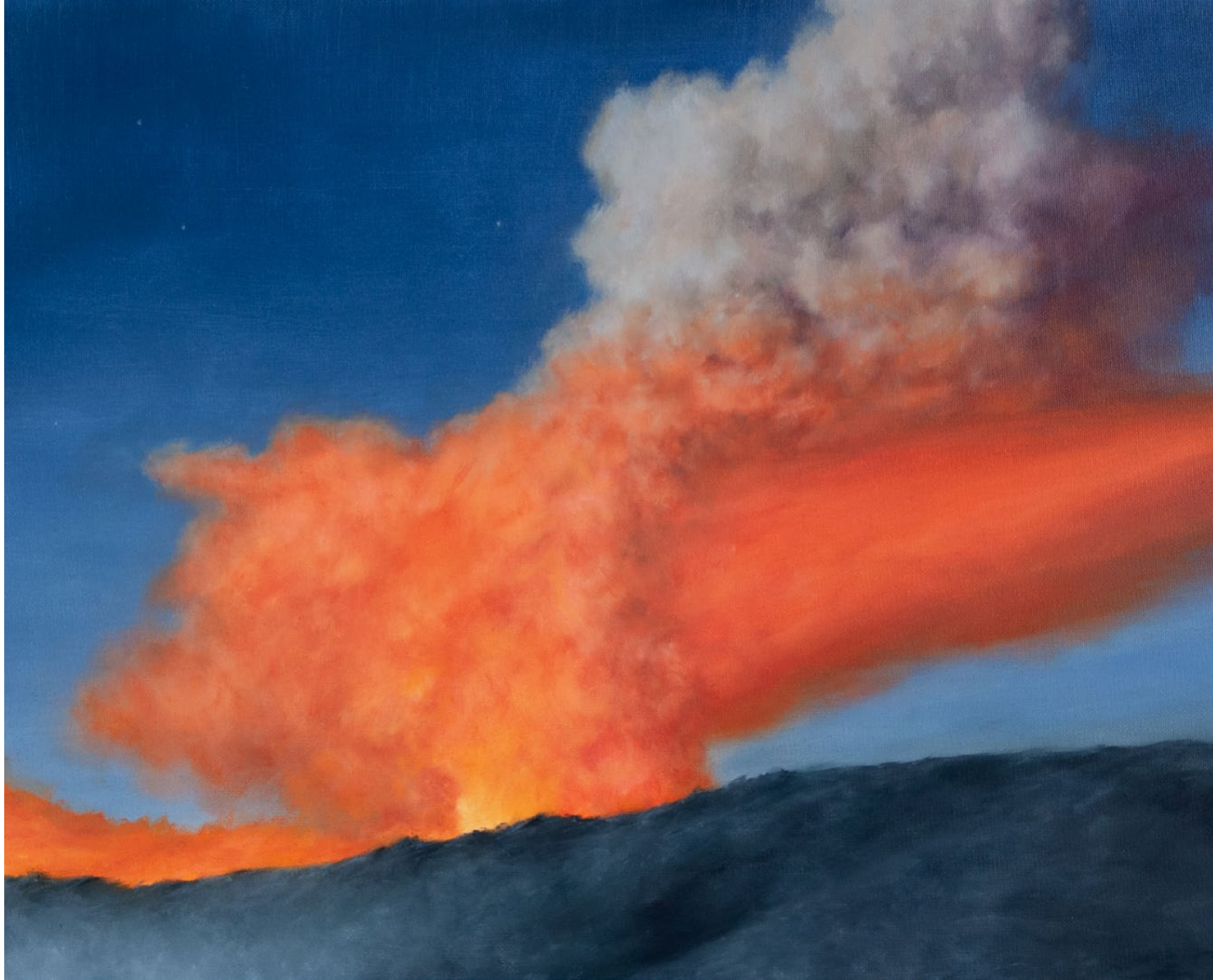
La Veillée - 2025, peinture à l'huile sur toile, 33 x 41 cm.