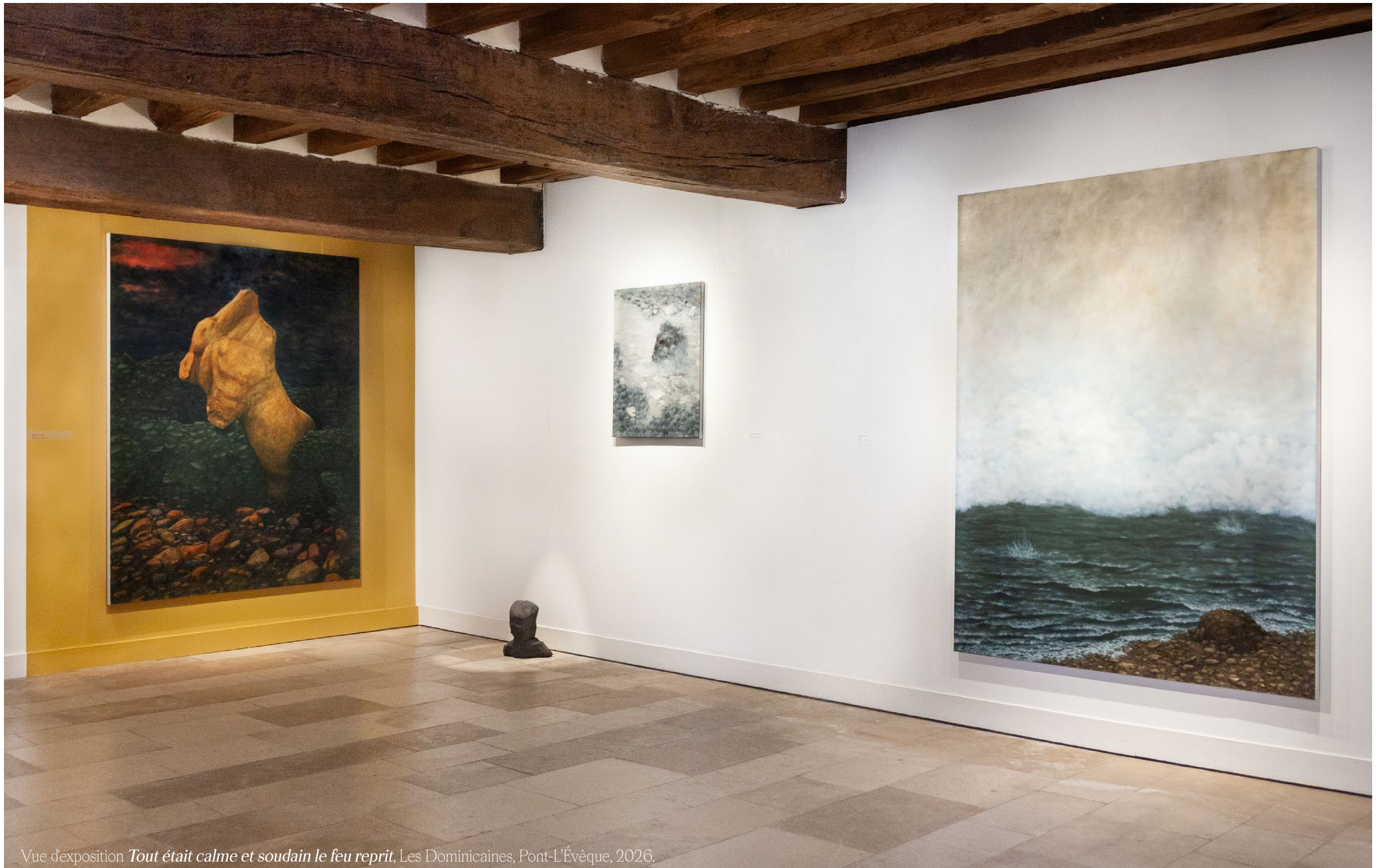
Vue d'exposition Tout était calme et soudain le feu reprit , Les Dominicaines, Pont-L'Évêque, 2026.