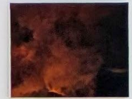
Vue d'exposition Prima Forma , Usine Utopik, Tessy-Bocage, 2025.