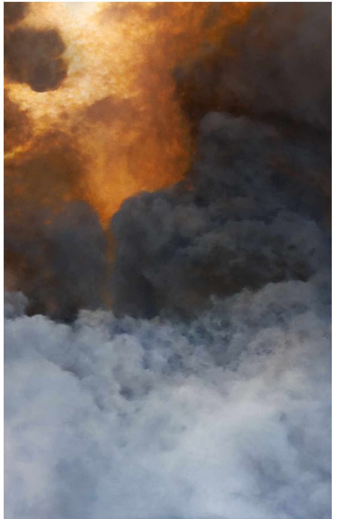
L'Heure dorée II - 2025, peinture à l'huile sur toile, 322 x 205 cm.