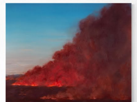
Série de méga-feux (en cours), 2020 - 2026, peintures à l'huile sur toile de 33 x 41 cm chacune.