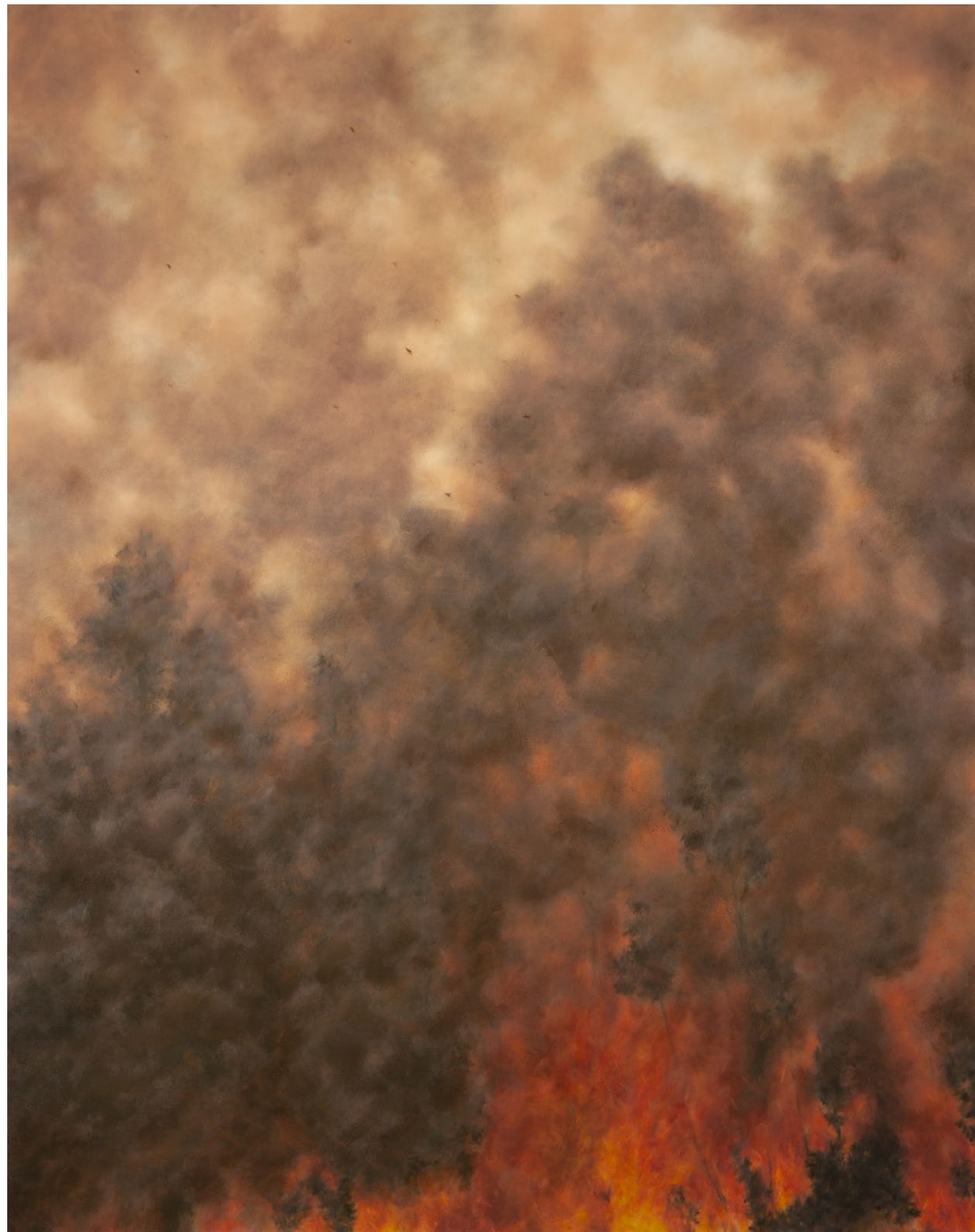
Volatilisés - 2025, peinture à l'huile sur toile, 92 x 73 cm.