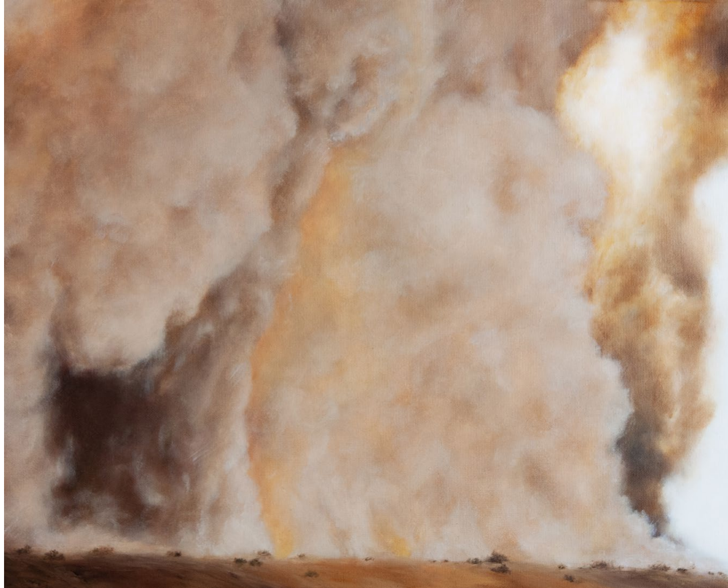
Contre-jour - 2026, peinture à l'huile sur toile, 33 x 41 cm.