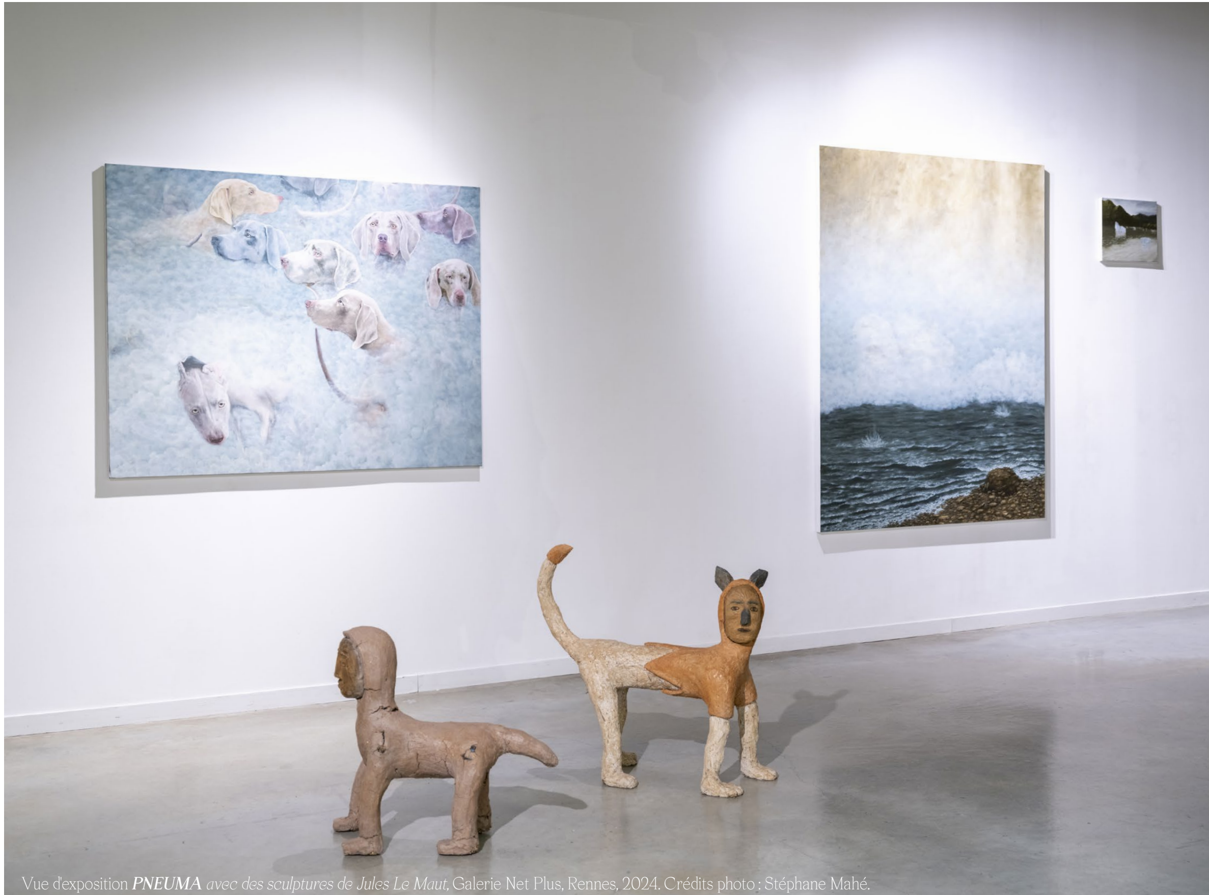
Vue d'exposition PNEUMA avec des sculptures de Jules Le Maut, Galerie Net Plus, Rennes, 2024.