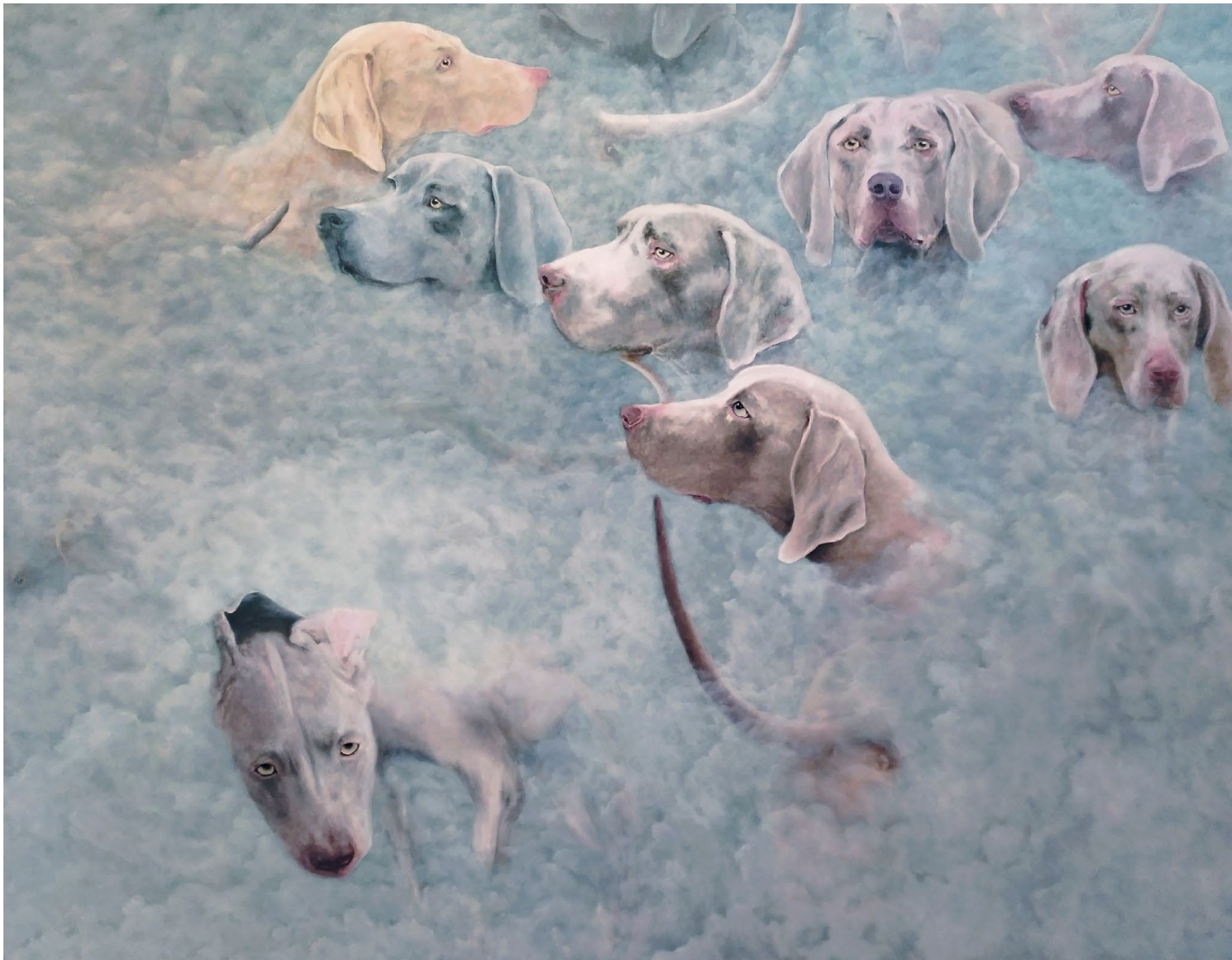
Cerbère - 2022, peinture à l'huile sur toile, 115 x 145 cm.