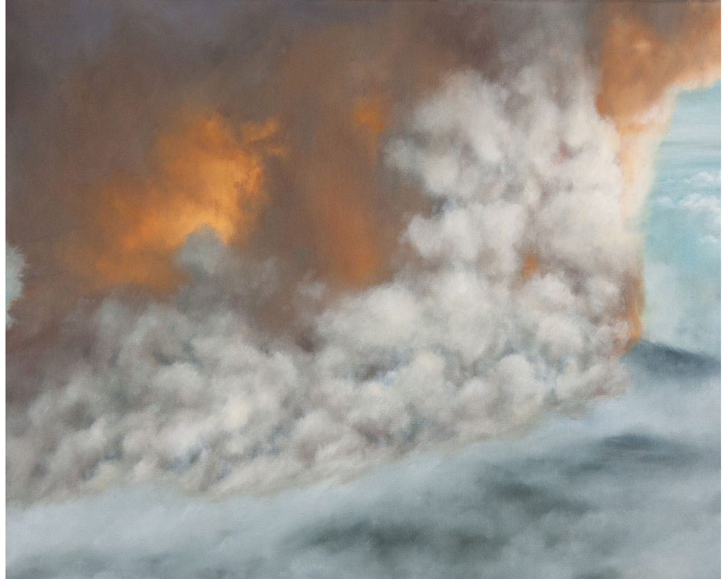
Le Souffle - 2025, peinture à l'huile sur toile, 33 x 41 cm.