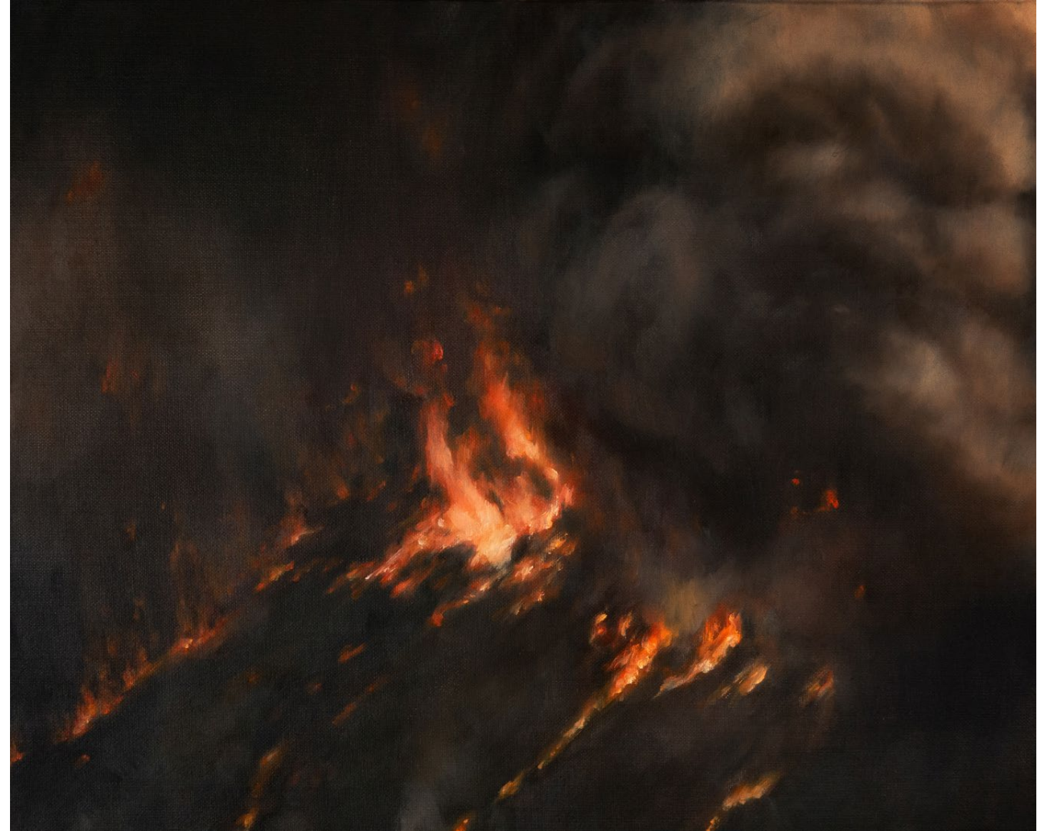
L'Embrasement - 2025, peinture à l'huile sur toile, 33 x 41 cm.