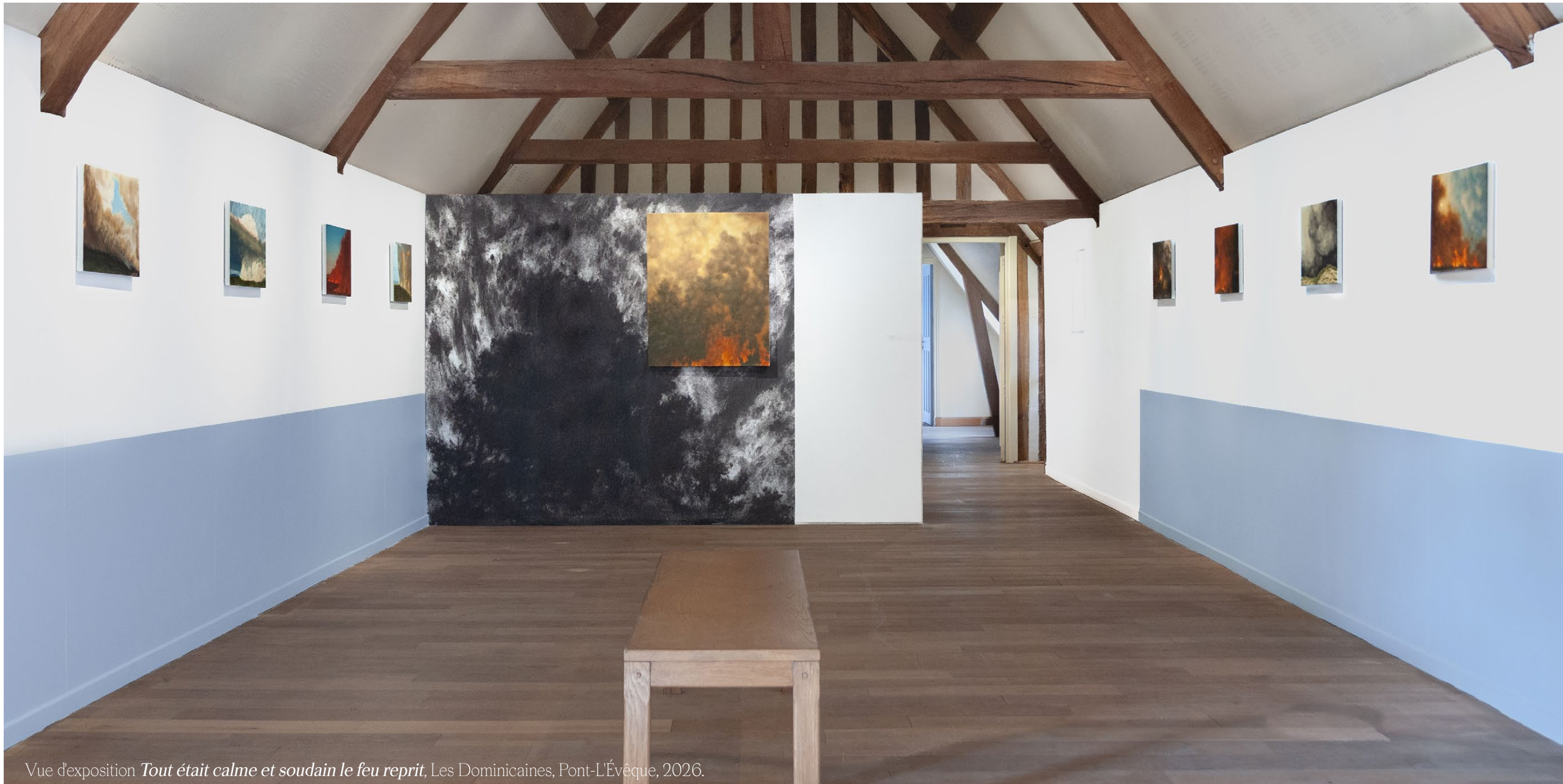
Vue d'exposition Tout était calme et soudain le feu reprit , Les Dominicaines, Pont-L'Évêque, 2026.