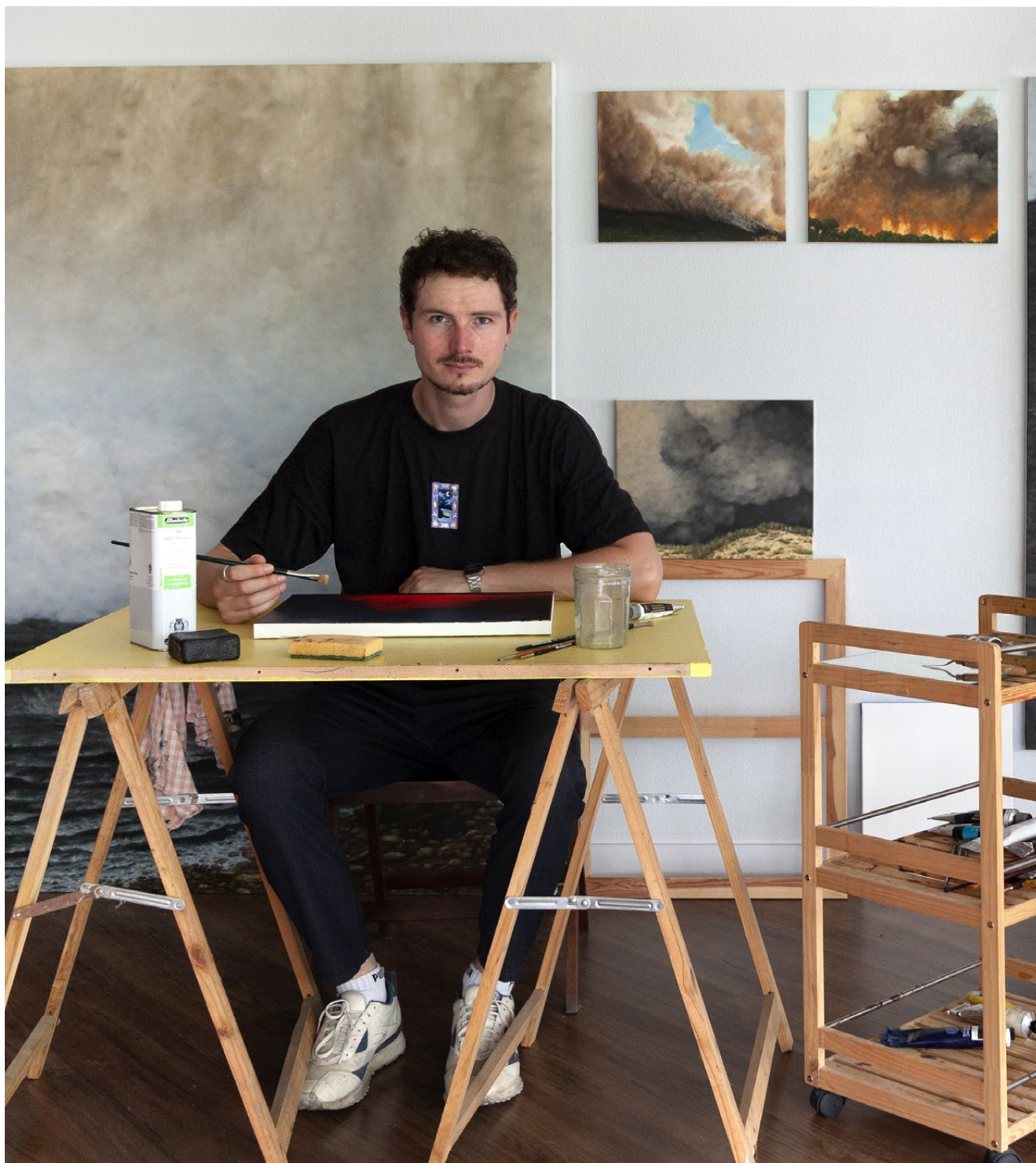
Vue d'atelier à Terrains Vagues , Rennes.

Dans le travail de Tom Nadam, il est illusoire de chercher l'étincelle. Le feu est en réalité déjà là. Que ce soit dans la tension latente qui émane de scènes pourtant minérales, dans lesquelles la vie n'est pas montrée ; dans ces représentations canines en suspension, parfois vaporeuses, qui laissent présager l'excitation de la meute ; ou encore dans les représentations littérales de méga-feux ravageant une nature réduite à l'état de bois de chauffe, l'action faisant basculer l'atmosphère n'est jamais clairement désignée.