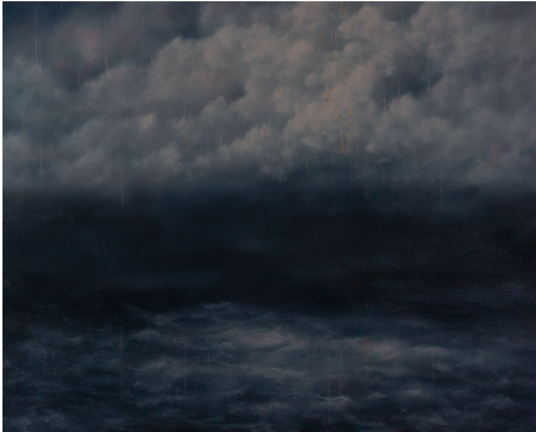
La Menace venue du ciel - 2024, peinture à l'huile sur toile, 40 x 50 cm.