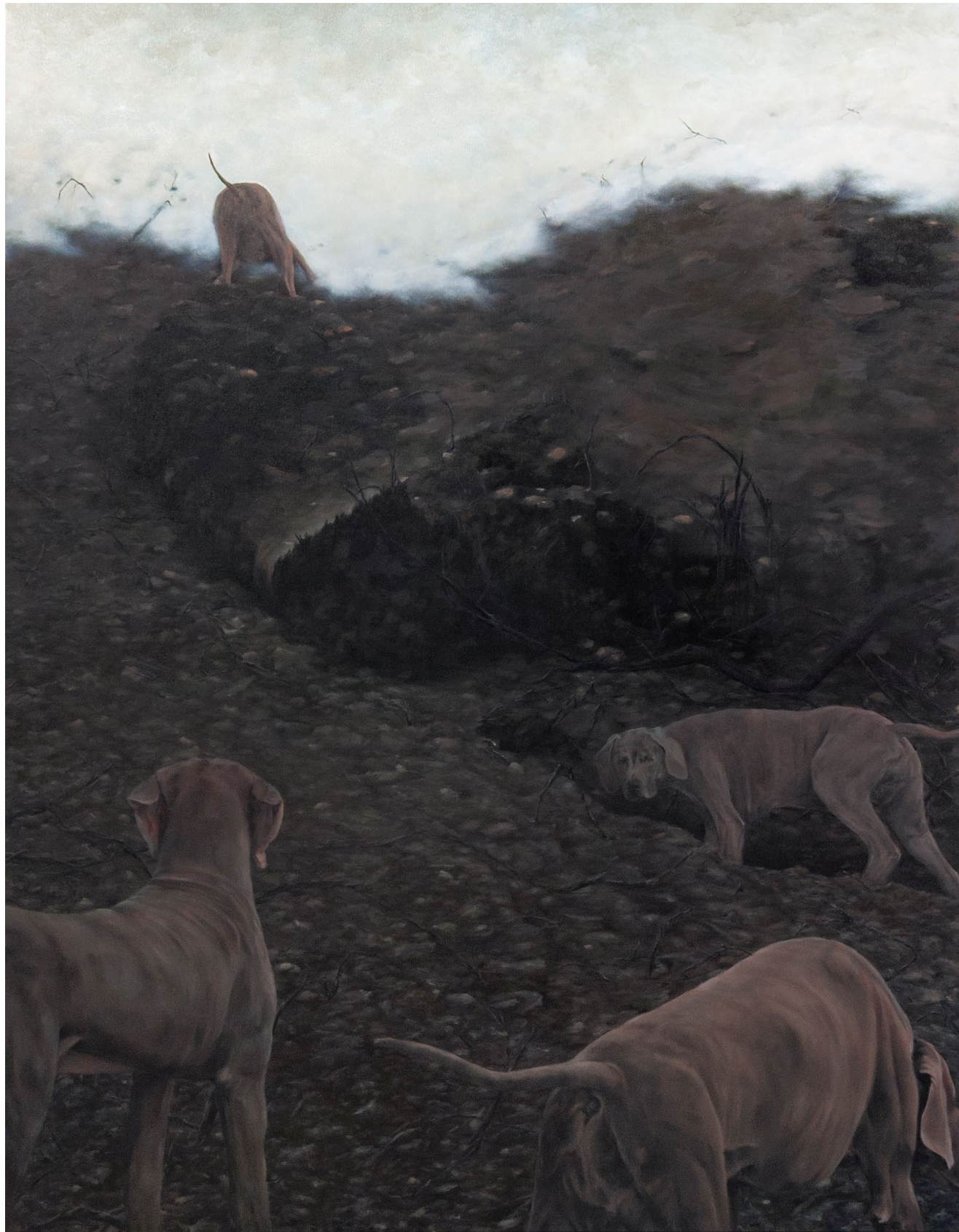
Monts et chiens d'arrêt - 2024, peinture à l'huile sur toile, 145 x 115 cm.